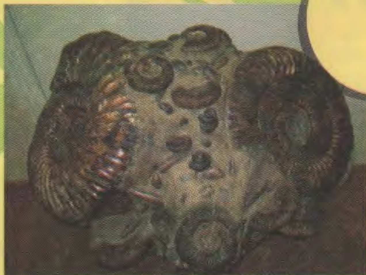
Аммониты – вымершие родственники кальмаров, осьминогов и других головоногих моллюсков.

Эпоха палеолита (2,5 млн. лет назад) – первые следы жизни людей на территории Симбирского Поволжья.