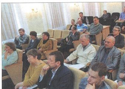
Первое заседание возрождённого ВООПИКа. 17 апреля 2014 года

Наследие Симбирского-Ульяновского края уже включает в себя более 280 объектов федерального, регионального и местного значения, стоящих на государственной охране. Но многочисленные территории и объекты ещё ждут изучения и постановки на государственную охрану. Очень мало изучены южные районы Ульяновской области. Если всё задуманное воопиковцами осуществится, то мы увидим преобразённый город не только на компьютерной картинке сайта «Симбирск-проекта», но и в реальности. Вполне возможно, за 35 лет будут восстановлены и Дом Карамзина, и Дом Свободы, и усадьба Перси-Френч в Винновской роще, и многочисленные храмы и соборы патриархального Симбирска. Осталось только всем миром содействовать грандиозным планам Общества по охране памятников и вступать в его ряды.