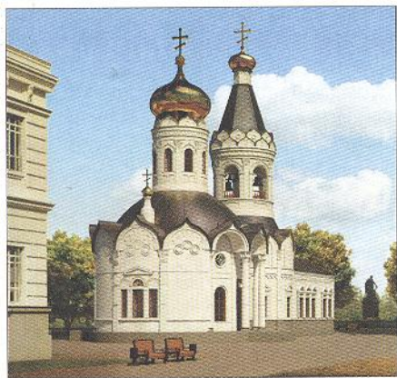
Виртуально воссозданные утраченные храмы Симбирска:

Никольская церковь располагалась на месте перекрёстка улицы Гимова (бывшей Никольской улицы) и эспланады