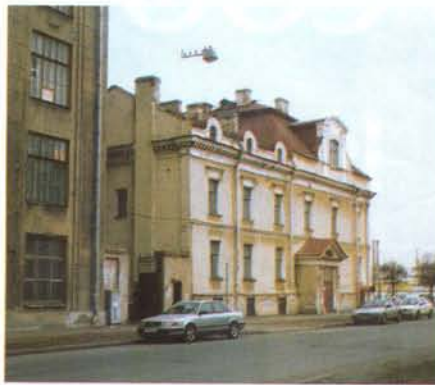
Дом Гросшопфов в Санкт-Петербурге