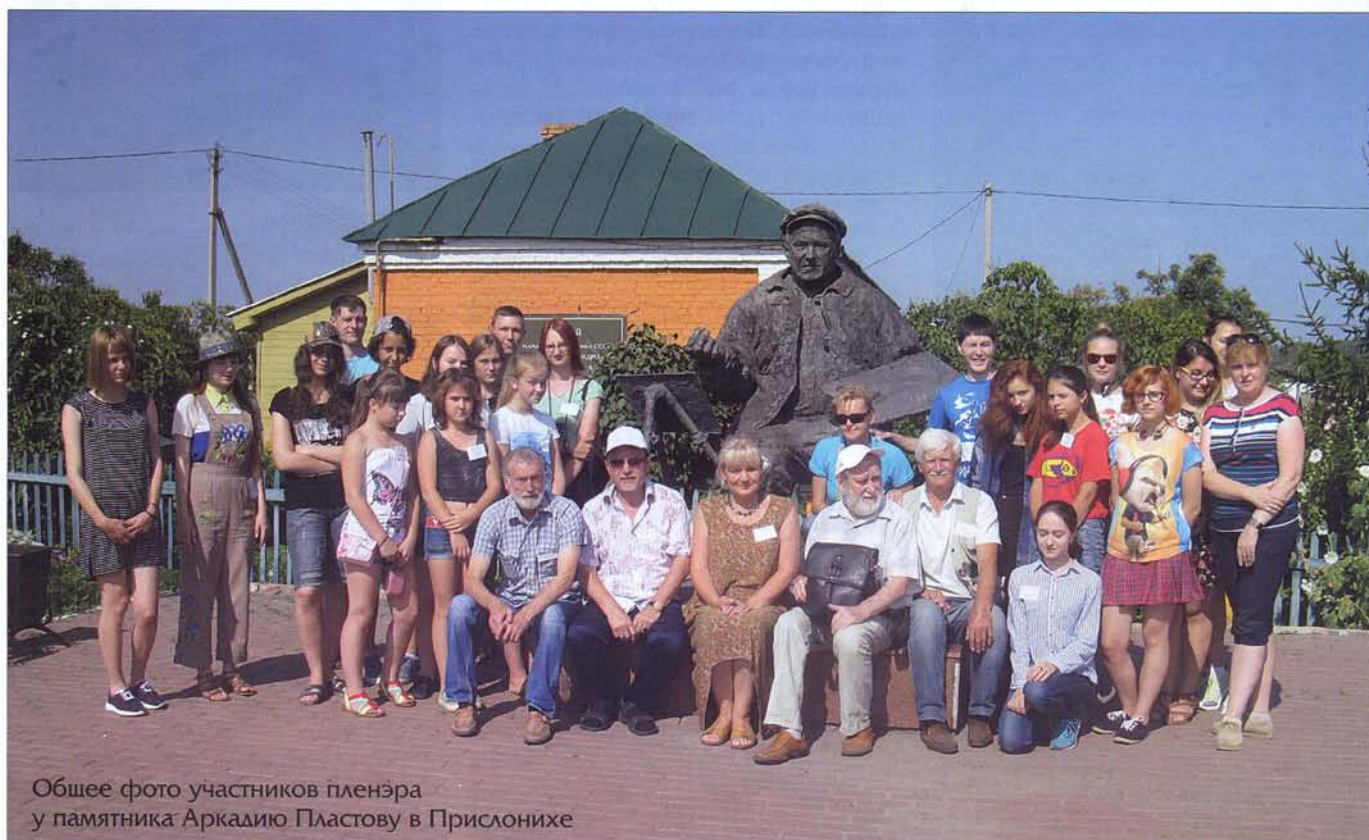
Общее фото участников пленэра у памятника Аркадию Пластову в Прислонихе