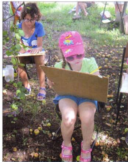
На мастер-классе ученики Сурской школы искусств

и напоминаний; корпуса общежития агротехникума, который предоставили гостям, пустели. Юные художники с этюдниками разбредались по понравившимся местечкам: кто-то рисовал сверкающие на солнце гребни волн могучей Суры, серебристую листву прибрежных ив, другая часть участников шла к Николиной горе, а некоторые «оседали» перед старинными особняками бывшего Промзино.