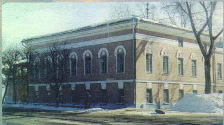
На фото: 1. Губернские присутственные места. 2. Женская тюрьма (бывший дом В.М.Карамзина). 3. Дом Языковых на ул. Спаской. 4. Здание Уездного суда по ул. Московской.