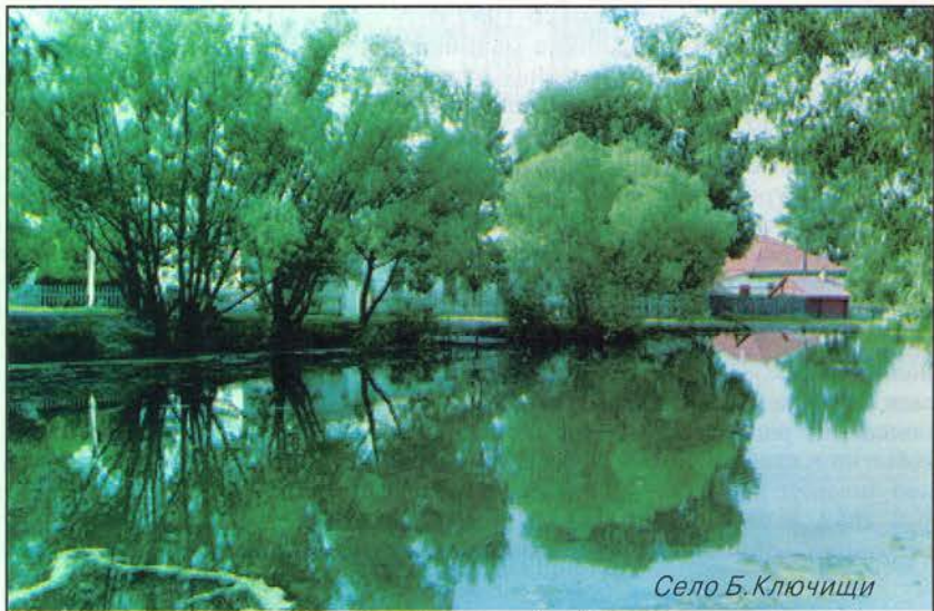
Село Б. Ключицы