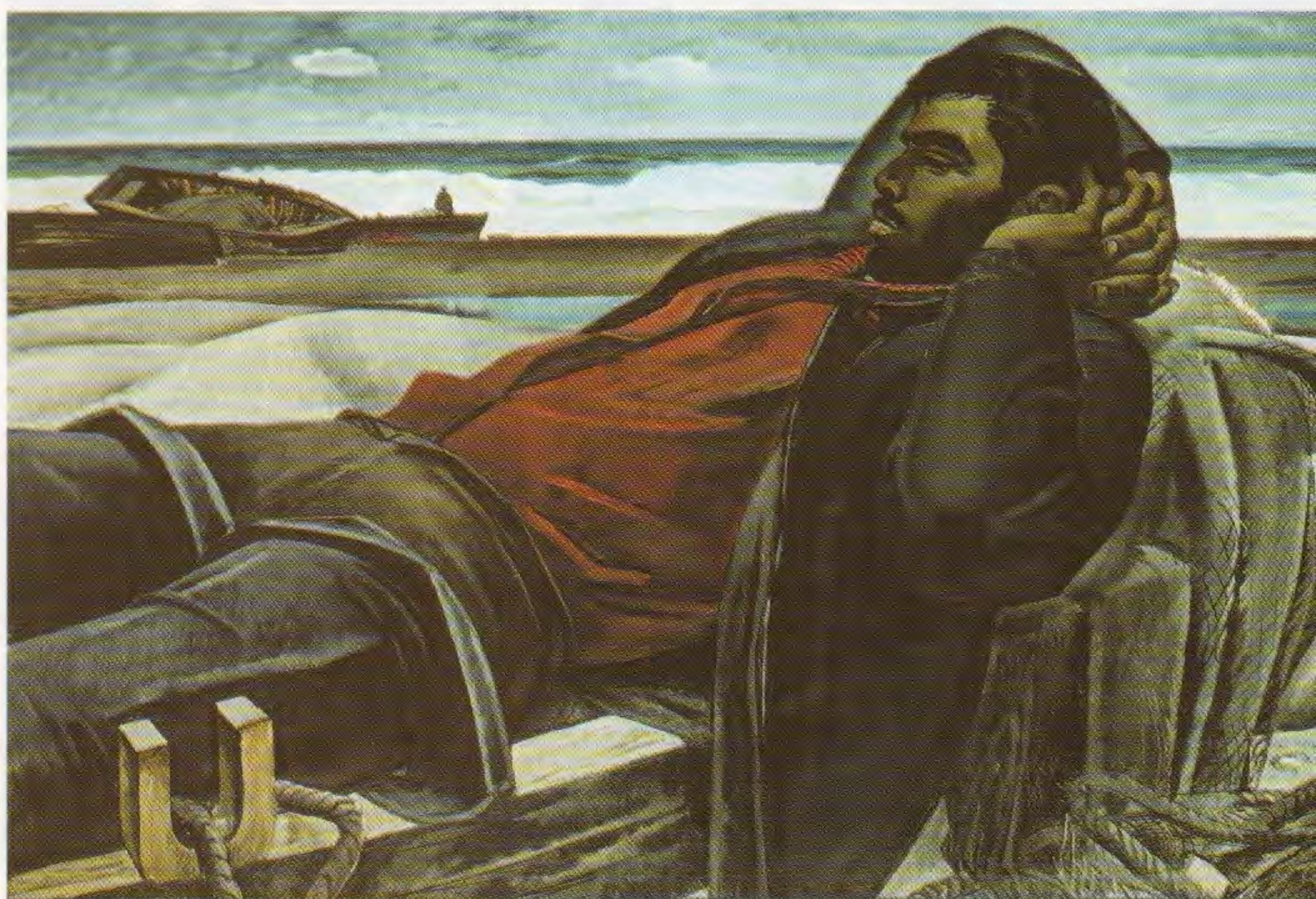
Т.Т. Салахов. У Каспия. Государственная Третьяковская галерея. Москва. 1966

Изменения отразились и в живописной системе. И это вполне закономерно для Салахова, которого можно назвать человеком мира. Именно ему, имевшему тесные связи с известными художниками Европы и Америки, принадлежит честь открытия современного искусства Запада российскому зрителю в серии знаменательных выставок конца 1980-х – начала 1990-х годов.