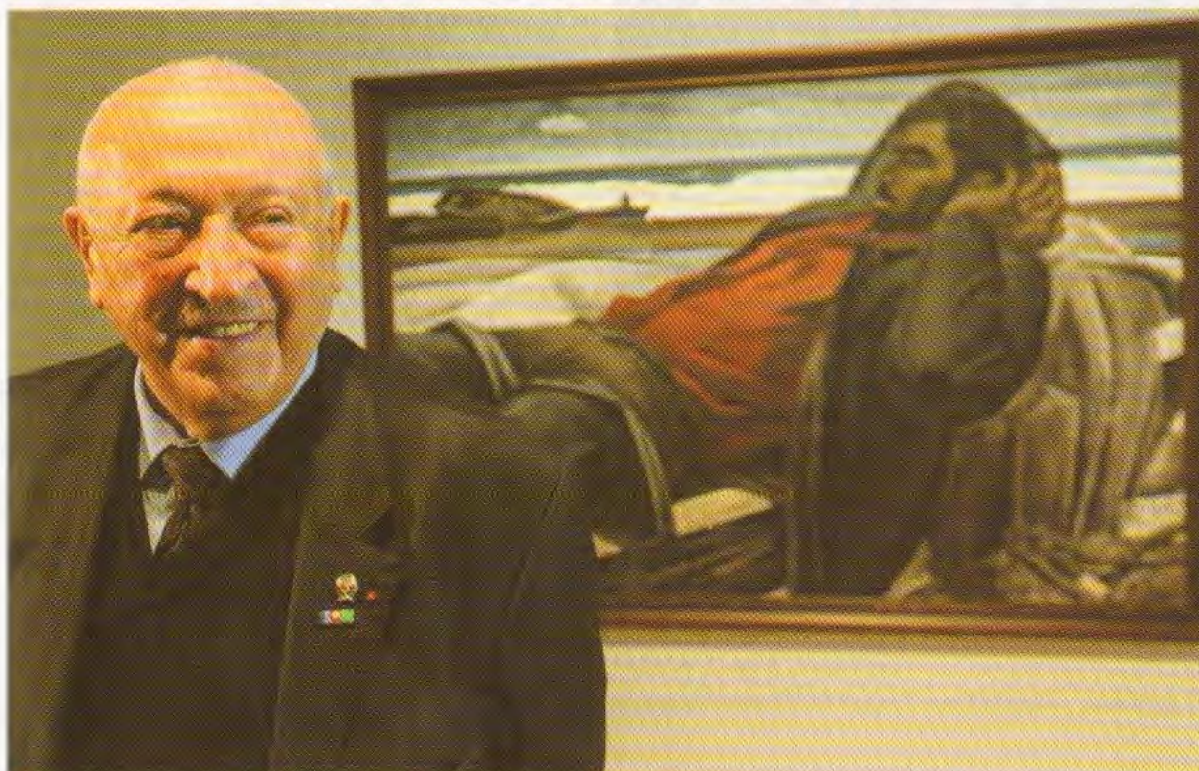
Т.Т. Салахов на фоне своей работы «У Каспия». Выставка «Большие имена». Ульяновск. 2018

В картине огромную роль в организации пространства играет линейное начало, пришедшее на смену цветопластике работ 1960-х годов. Тогда Салахов был одним из тех молодых шестидесятников, которые открывали для себя и для публики постимпрессионистические приемы в структуре живописи. Но уже в ранних работах художника, таких как «Женщины Апшерона» (1967), протяженные, мощные линии не только строят форму, они рожают образы, исполненные внутренней силы и стойкости. Стремление к предельному обобщению и стилизации объемов пронизывает всю картину «Отдыхающий...», начиная от изображения небосвода, словно распадающегося на кубические объемы, и заканчивая песчаными дюнами, обретшими правильные, строгие контуры. Колорит, построенный на сопоставлении больших красочных зон, внезапно взрывается пятном красного, вносящим яркий цветовой акцент в сдержанную в своей основе красочную гамму. Если в этой картине господствуют круглящиеся линии волн, дюн, поддержанные мягкими очертаниями лежащей фигуры, то иное решение избирает Т.Т. Салахов в картине «Вид из мастерской. Москва» (2016). Столкновение вертикалей и горизонталей наполняет картину энергией движения. Монументальные вертикали дверного проема смягчены ритмом стройной