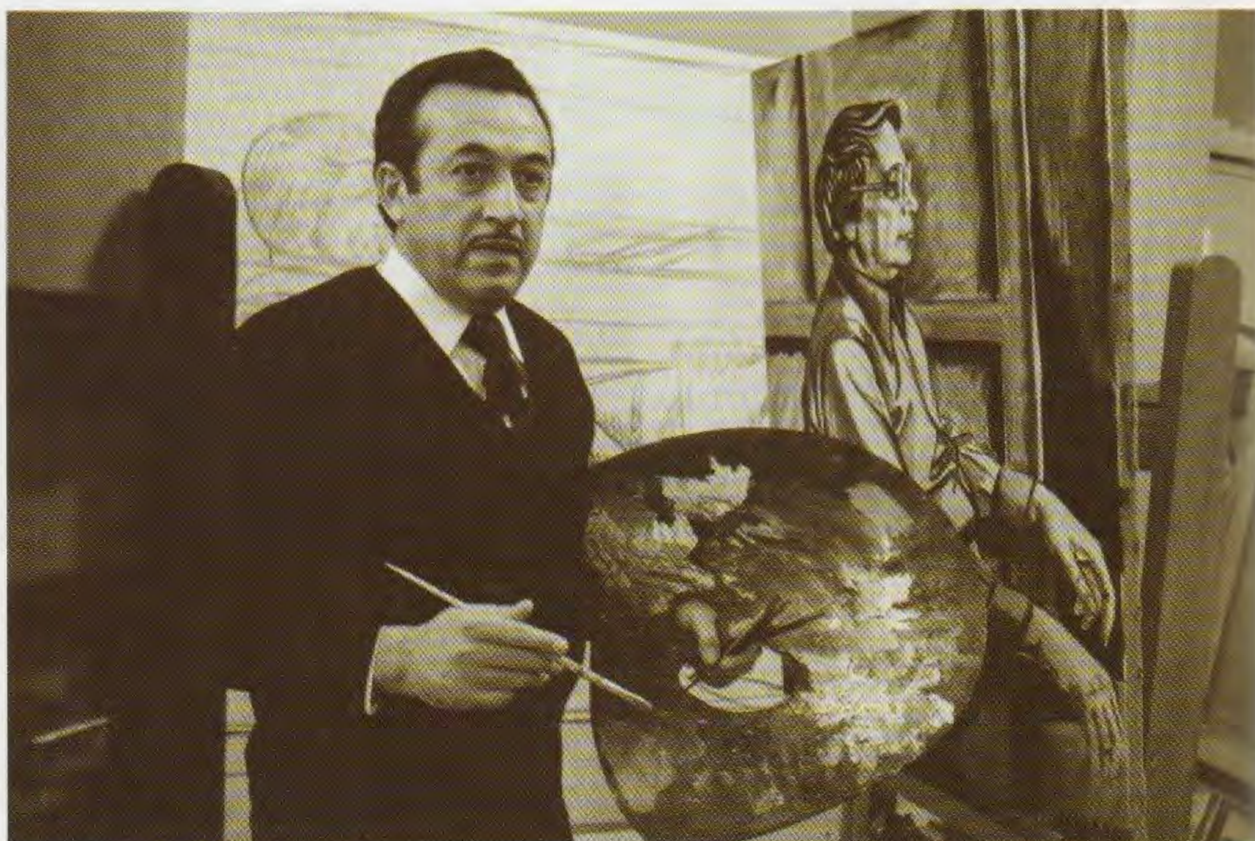
Таир Теймурович Салахов, народный художник Азербайджана и России

Международная ассамблея художников «Пластовская осень» с 2011 года дарит ульяновцам и гостям города встречи с творчеством современных художников, известных мастеров – приверженцев традиций мирового и отечественного классического искусства. Выставка «Большие имена» в рамках «Пластовской осени-2018», посвященная 125-летию со дня рождения Аркадия Александровича Пластова, была развернута в выставочных залах Ульяновского областного художественного музея и его филиала – Музея изобразительного искусства XX–XXI веков. За семь лет, в течение которых в Ульяновске собираются самые именитые и прославленные мастера живописи, скульптуры и графики России и ближнего зарубежья, более тридцати из них стали лауреатами Международной премии в области изобразительного искусства имени А.А. Пластова. В этом номере «Мономах» знакомит вас с творчеством народного художника Азербайджана и России Таира Салахова.