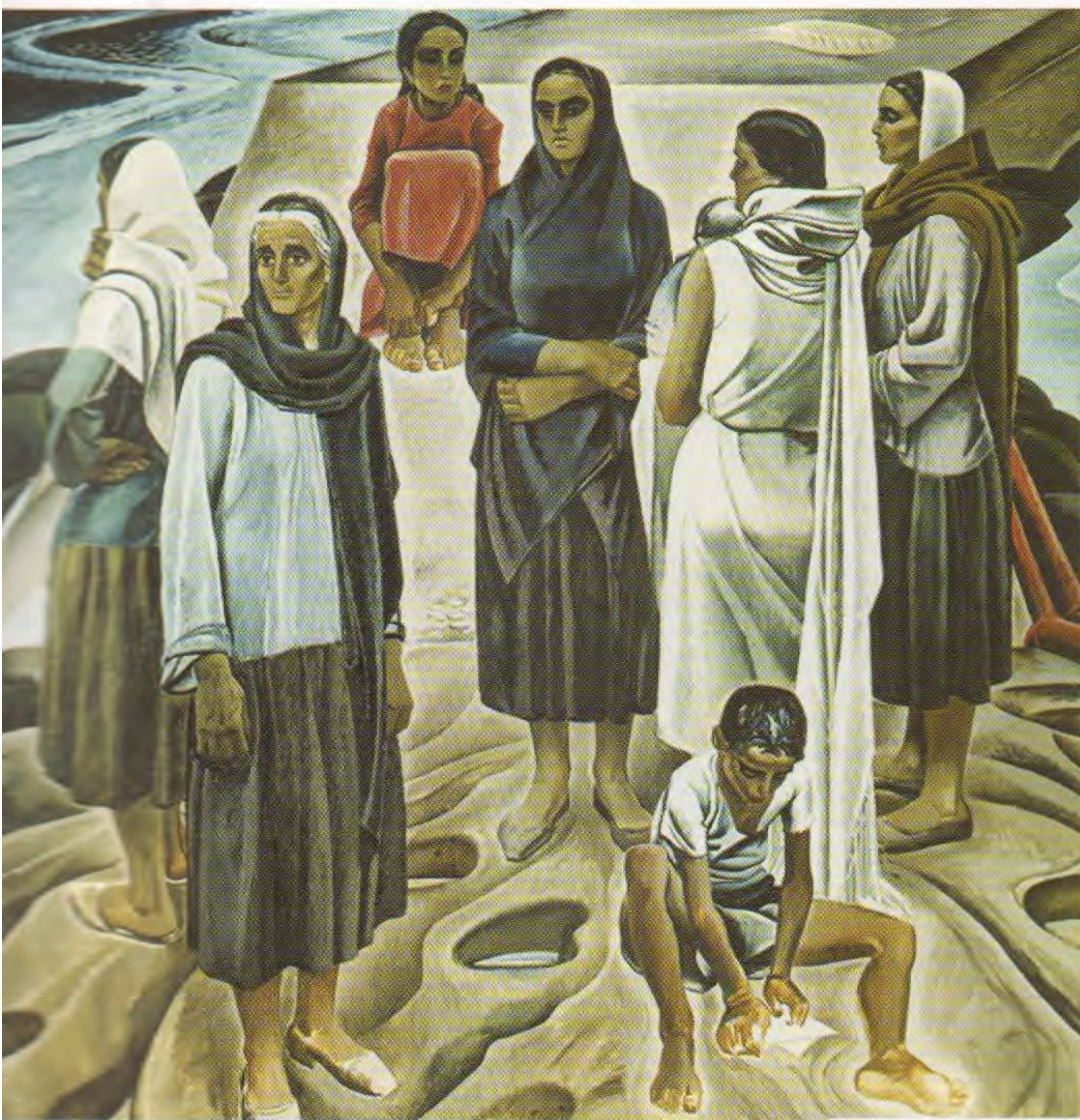
Т.Т. Салахов. Женщины из Аншерона. 1967

и хрупкой балконной решетки, обогащены вольной статьёй художнических кистей в стеклянном сосуде. Мягко ниспадающие портьеры играют роль театрального занавеса. Освещенные ступени ведут из полумрака мастерской на балкон как на сцену, обещая встречу с городом, обществом, людьми. Но есть одна очень важная деталь, которая увлекает обратно в мастерскую, наполненную атмосферой ежедневного творческого бытования, – это скромная простая табуретка, напоминающая знаменитый стул Ван-Гога.