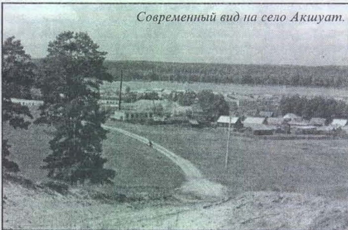
Современный вид на село Акшут.