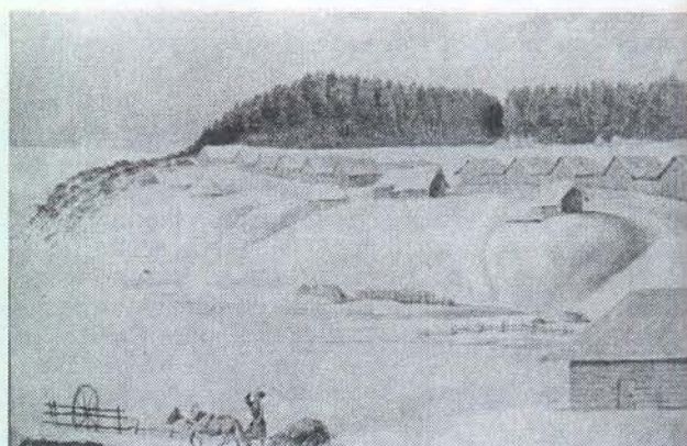
Н. Поливанов. Вид на село Акишат.

состоящую, как пишет Поливанов, “почти исключительно из французских изданий. ... лучших философских сочинений конца 18 века”.