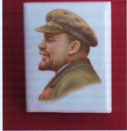
Плакета фарфоровая с изображением В.И. Ленина. Дулевский фарфоровый завод, с. Дулево Московской области. 1920-е

Одни и те же афоризмы оказывались на страницах газет и журналов, на предпраздничных панно и постаментах памятников, на досках, укрепленных на стенах домов, и на стенках чашек, на