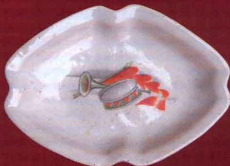
Вазочка для варенья с пионерской символикой. 1930-е