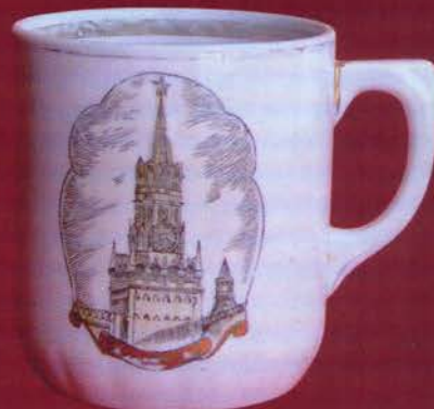
Бокал фарфоровый с изображением Спасской башни Кремля (изготовлен к 800-летию Москвы). Дмитровский фарфоровый завод. Вербилки, Московская область. 1947