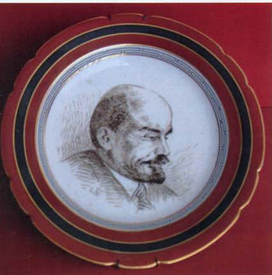
Тарелка декоративная фарфоровая с изображением В.И. Ленина. Завод «Пролетарий». Не ранее 1918

Новое клеймо завода исполнил художник А.Е. Карев. Оно представляло собой государственный герб – перекрещенные серп и молот, и часть шестерёнки – символ заводской промышленности. Такой маркой с обозначением даты метились изделия завода, расписанные после 1918 года. В особых случаях эта марка несколько видоизменялась, например, на изделиях, выпущенных к 5-й годовщине Октября, рядом с клеймом ставилась римская цифра V.