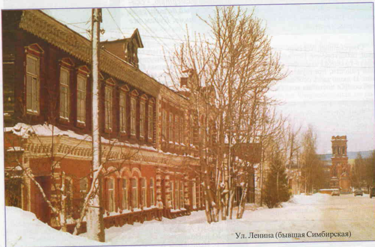
Ул. Ленина (бывшая Симбирская)

Я родился в селе Иваньково Алатырского уезда. В 1914 году наша семья переехала в г. Алатырь, где отец поступил работать смотрителем (завхозом) Алатырской земской больницы. Семья была большая, своего дома не было, жили по квартирам. По рассказам мамы и сестер, весь заработок отца уходил на питание. Одевались кое-как, было лишь самое необходимое.