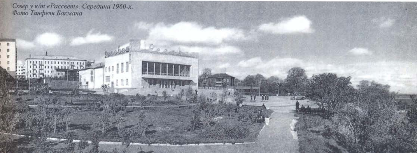
Сквер у к/т «Рассвет». Середина 1960-х.