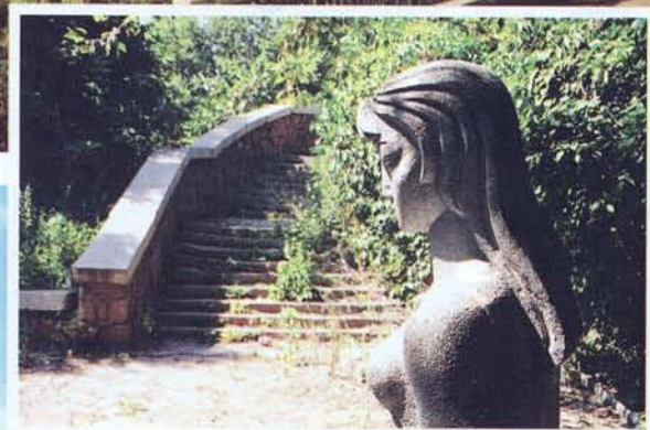
В парке Дружбы народов. Начало XXI века.