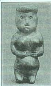
Богиня плодородия Анамаш

Однако об ушедших языческих богах мы можем узнать из воспоминаний путешественников, из летописей, фольклора, работ исследователей, писателей, очевидцев. О былом свидетельствует и местная топонимика: овраг Киремети, дерево Киремети, Киремети на Свияге, на Цильне, на Волге.