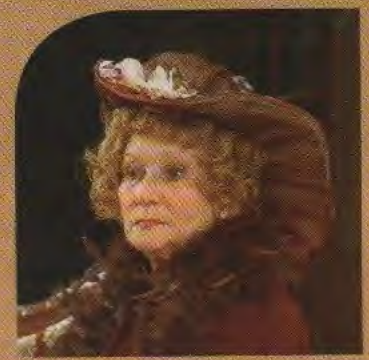
Кларина Ивановна Шадько

За полвека служения на сцене Ульяновского драматического театра Кларина Ивановна сыграла более 200 ролей. Народная артистка РСФСР, почетный гражданин города Ульяновска, лауреат Государственной премии РФ. Занесена в региональную Книгу почета «Герои малой Родины».