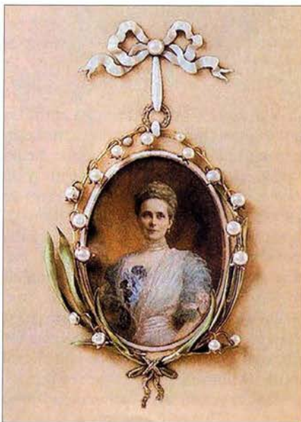
Портрет княгини З.Н. Юсуповой. Миниатюра В. Зуева. 1907.

Художник возвращается в родное Заволжье, о котором всегда помнил, где жили дорогие ему люди – братья и сёстры, племянники и племянницы, и начинает совсем другую жизнь.