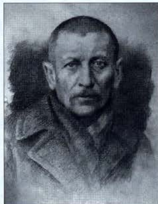
Работы В.И. Зуева, представленные его родственниками