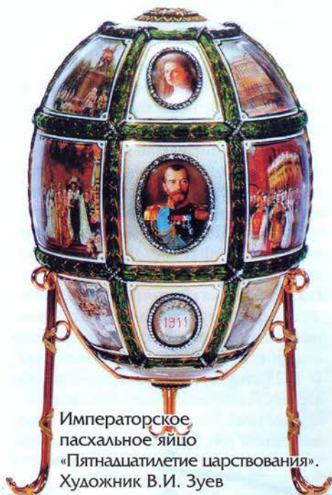
Императорское пасхальное яйцо «Пятнадцатилетие царствования». Художник В.И. Зуев

Уже 20 мая 1904 года В. Зуев представил первый выполненный заказ. В течение года он выполнил 11 миниатюр с портретами царствующих особ. Всего за 1904–1917 годы им выполнено около 200 миниатюр царствующих особ и представителей высшей аристократии.