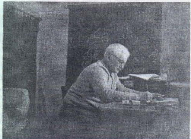
На даче в Рузе. 1958 год.