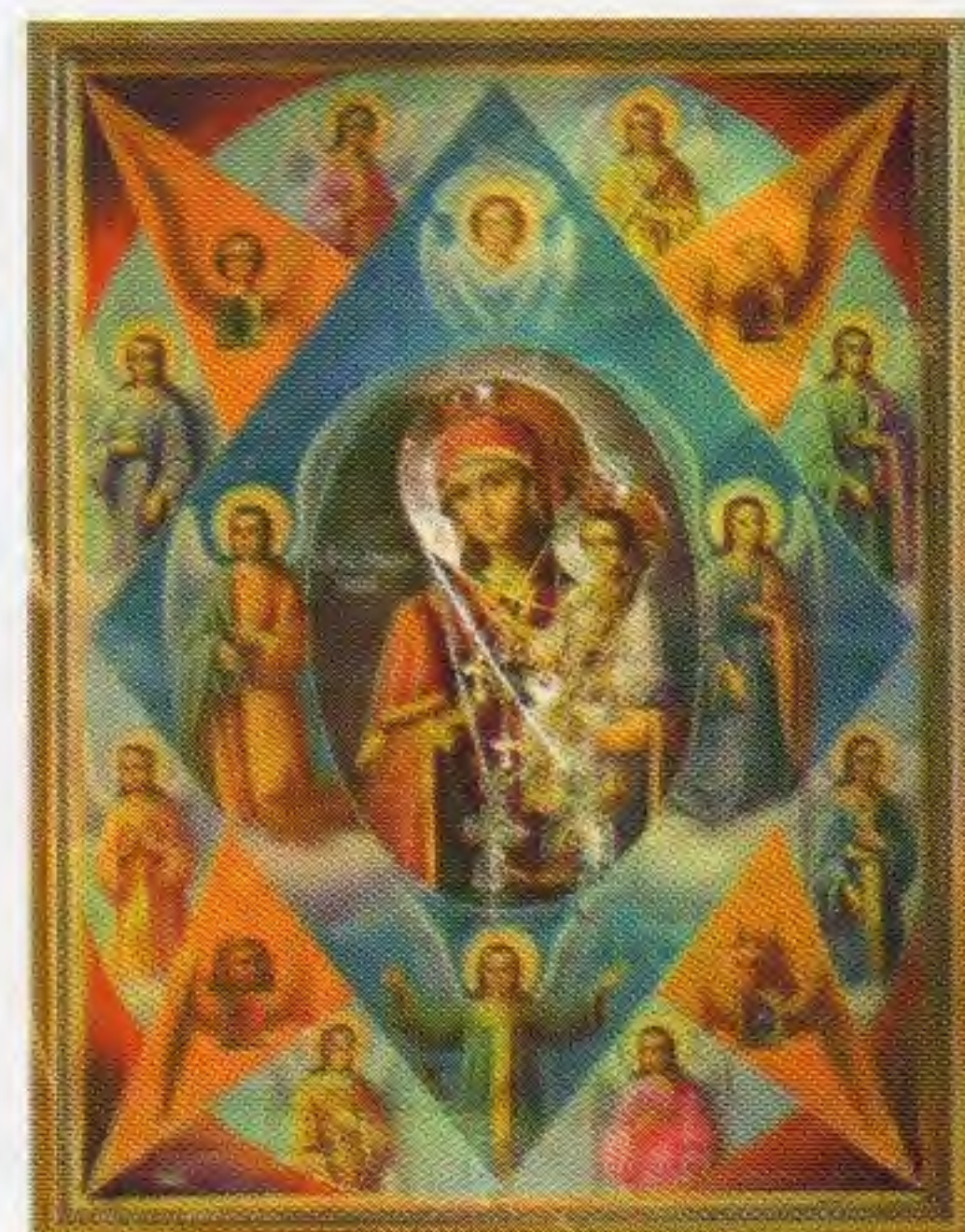
Образ Божией Матери «Неопалимая Купина»

Кроме репрессий Богородице-Неопалимовский храм прошёл через расколы: сначала григорианский, а потом – обновленческий. В 1941 году