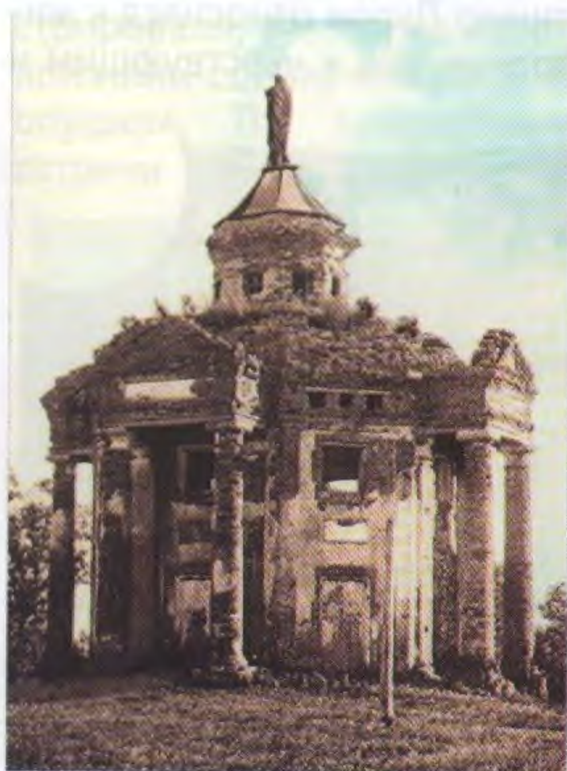
Беседка-храм со «статуйкой»

В восточной части Винновской рощи до 30-х годов прошлого века располагалось ещё одно необычное архитектурное сооружение.