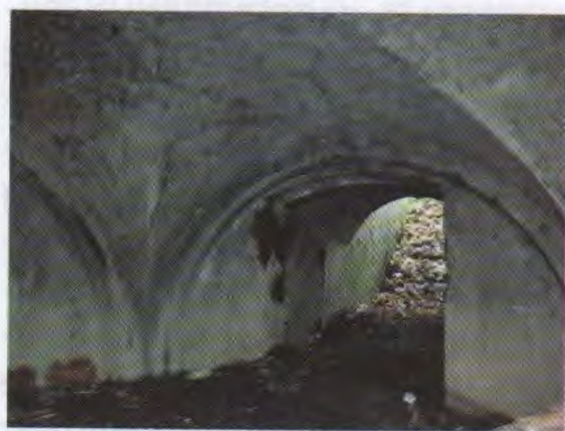
Склеп семьи Киндяковых