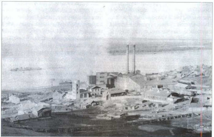
Симбирский бетонный завод