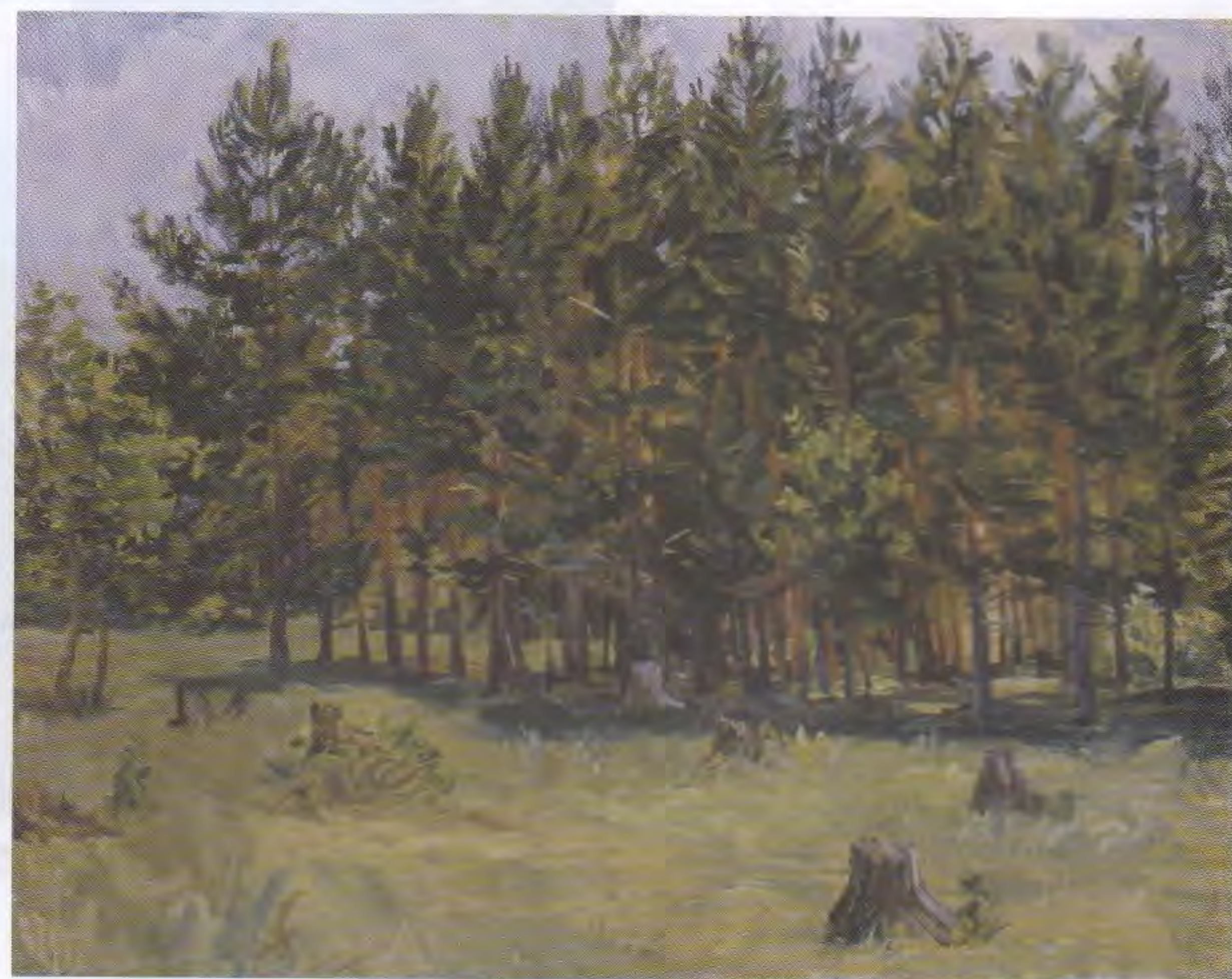
А.А. Пластов. Молодые сосны. 1938–1939. УОХМ

Это леса, связанные с жизнью и творчеством художника А.А. Пластова, они выделены на основании распоряжения Совета министров РСФСР от 8 июля 1982 года и распоряжения Ульяновского облисполкома от 31 июля 1991 года. Леса расположены около села Прислониха, в котором жил и творил художник Аркадий