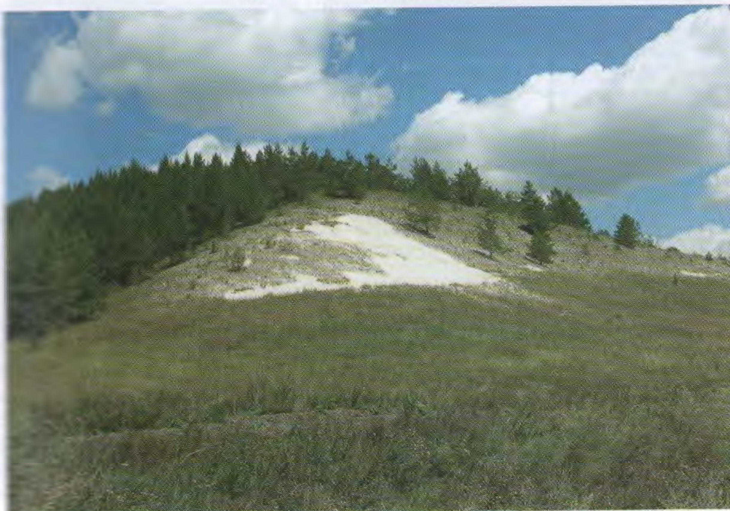
Ляховские меловые горы

Первомайского лесничества Майнского лесхоза, где проработал до 2008 года. В 2004 году окончил Марийский государственный технический университет. В 2012 году назначен участковым лесничим Белоозерского участкового лесничества, в 2016 году – исполняющим обязанности директора Майнского лесничества, где продолжает работать по настоящее время. Заслуженный работник лесного хозяйства Ульяновской области.