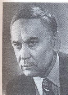
Сергей ВИКУЛОВ (1922–2006)

...Истинные поэты никогда не теряют из виду вечность! Говорят ли они о ней или только разумеют ее, она, вечность, все равно постоянно в них, как кровь в живом человеке. Николай Благов принадлежит к таким поэтам с тайной слова, видения, мирозерцания.