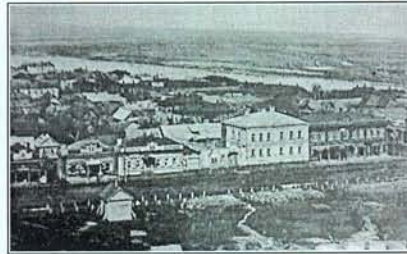
Тетюши. Общий вид

Идея строительства русских городков-крепостей на великом Волжском пути между Казанью и Астраханью появилась после присоединения края к Русскому государству, когда Волга стала основной торговой артерией страны.