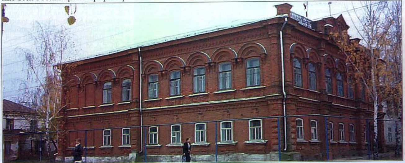
Тетюшский краеведческий музей

Спорт в Тетюшах вообще занятие культовое. В каком еще районном городке найдется столько талантливых спортсменов? А тут еще в планах открытие школы олимпийского резерва по тяжелой атлетике имени двукратного олимпийского