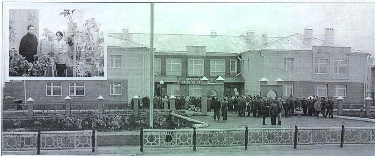
Открытие детского сада «Сказка»

В этом году в районе собран хороший урожай зерновых. Только вот сбыть некуда – по всей России скупается зерно почти что даром. Крестьяне ПСХК «Путь Ильича» нашли своеобразный выход: зерно оставляют на корм, увеличивая его привесы. Наилучшей эффективности зернового поля добились в совхозе «Садовод». Благодаря стараниям