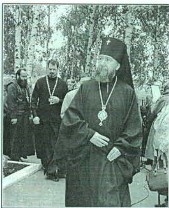
Архиепископ Казанский и Татарстанский на освящении часовни

В Татарстане осуществляется несколько интересных, очень нужных программ. Например, «Ветхое жилье»: предприятия платят налог в этот фонд, позволяющий строить современное жилье. По этой программе в Тетюшах должны быть построены 572 квартиры. На сегодняшний день сдано очередникам около 300 квартир, более двух тысяч семей улучшили свои жилищные условия. Однако нужное дело может заглухнуть: прокурор Российской Федерации