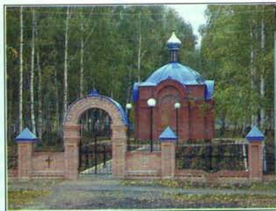
Часовня на старинном православном кладбище

Герб г. Тетюши представляет собой щит, разделенный на две части. Вверху – коронованный змей Зилант, внизу – два серебряных рыцарских копья: в древности жители края «употребляли с похвалю оныя орудия». Два щита подчеркивают двоякое значение города: с одной стороны, военно-опорный пункт русского государства, с другой – мирное поселение, жители которого занимались пахотным земледелием.