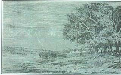
Тетюши. Гравюра XIX века

По первому преданию, Тетюши основаны на месте древнего болгарского городка Темтюзи, откуда и произошло современное название. По другой версии, имя свое город получил от болгарских слов «Тепс-тус», что означает «Ореховая гора». По третьей версии, название пошло от орловского «тетюшкать» - нянчить. Есть мнение, что название произошло от татарских слов «тау таи» (гора-камень) или «тау теш» (гора-зуб).