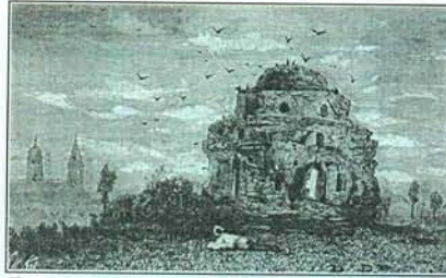
Булгарская мечеть. Гравюра XIX века

Это был типично купеческий город. Самое шумное и важное событие – ежегодная Воздвиженская ярмарка, которая открывалась 14 сентября (по старому стилю) и длилась неделю. Основными промыслами являлись лов рыбы, плетение лаптей, ткацкое дело, кузнечное мастерство, земледелие, мукомольное производство, хлебопечение, торговля. Самый значительный товар на тетюшском рынке – зерновой хлеб, скупкой которого занималось около 30 обществ с оборотом до двух миллионов рублей. В урожайные годы через Тетюши проходило до 11,5 тысяч тонн зерна. В городе работали 42 зерносушилки, 16 мельниц, 140 амбаров и лабазов. Купеческие династии Крупинцы, Серебряковых, Колсановых, Полосухиных были известны всей России.