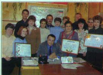
Коллектив тетюшской газеты «Авангард»

Важная особенность Тетюшского района – его интернациональность. Веками на этой земле проживает бок о бок несколько народов. Это – 30% татар, столько же русских, 22% составляют чувашки, 12% – мордва. Образовались и полнокровно живут сотни интернациональных семей. И в труде, и в праздники тетюшане всегда вместе, несмотря на разницу в вероисповедании, национальности.