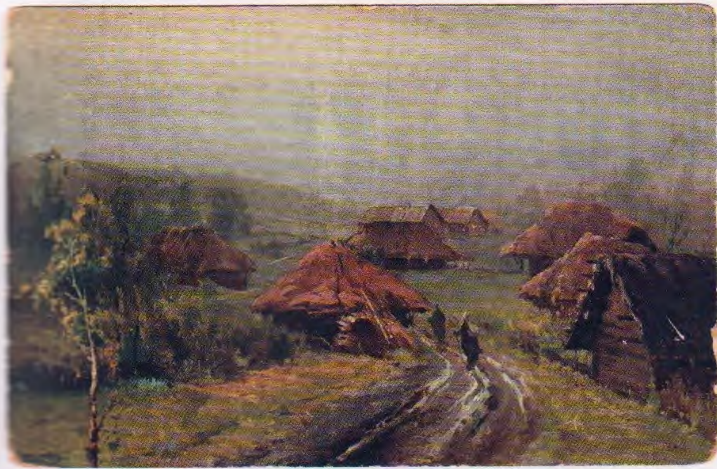
↑ Моросит. Худ. П.И. Пузыревский