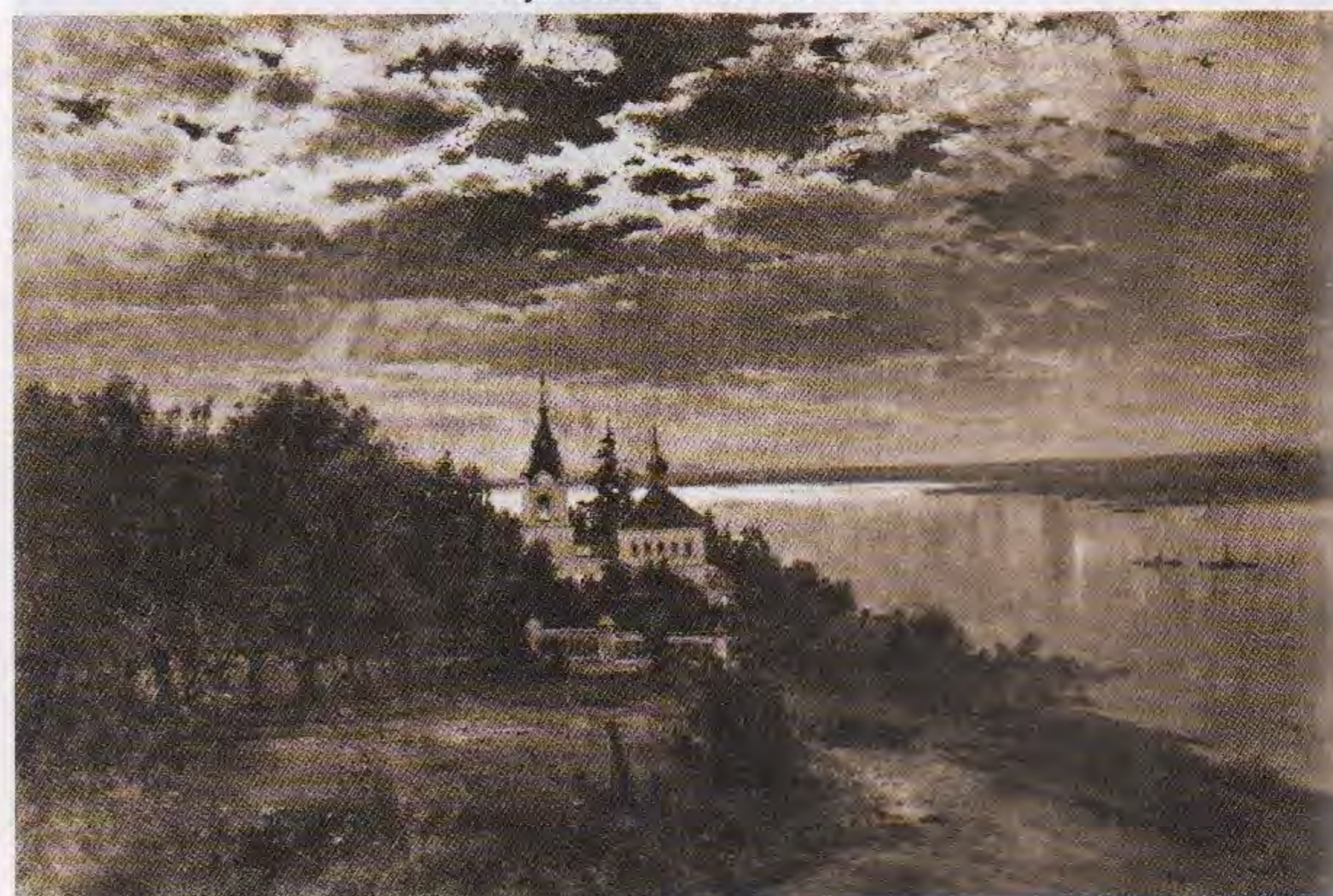
Лунная ночь на Волге