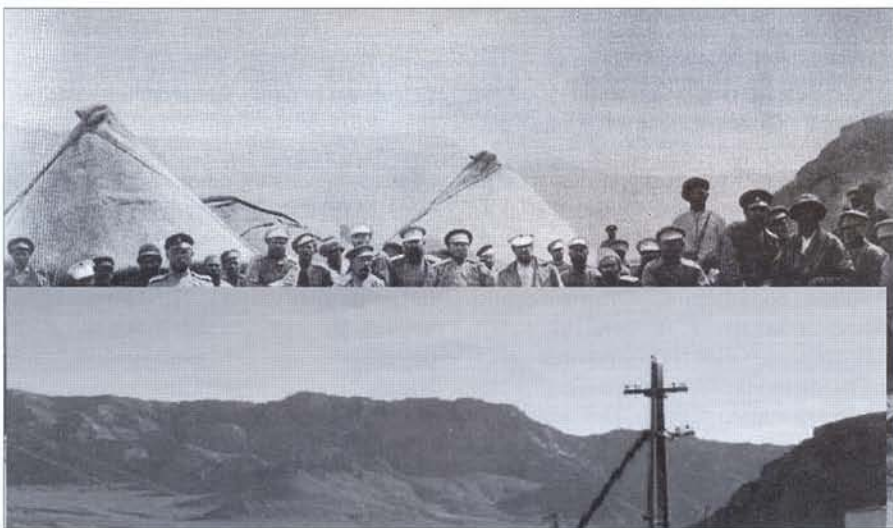
Сравнив линии горных хребтов на старых фотографиях и на местности, исследователям удалось определить место дислокации Шаджанского отряда (вверху) и Памирского поста (внизу)