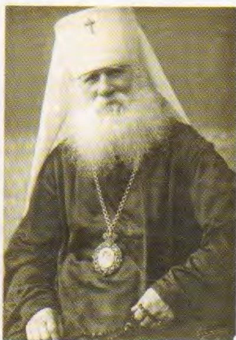
• Епископ Вениамин (Муратовский)

Недолго пробыл на этом посту и архиепископ Иаков : в 1911 году он был переведён в Казанскую епархию. Его сменил епископ Вениамин (в миру Василий Муратовский, 1856–1930).