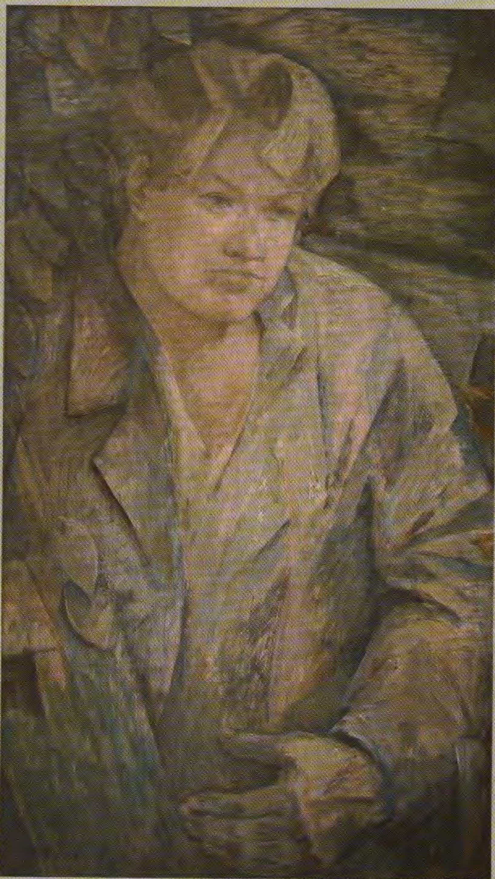
Николай Благов. Из цикла «Поэты России»