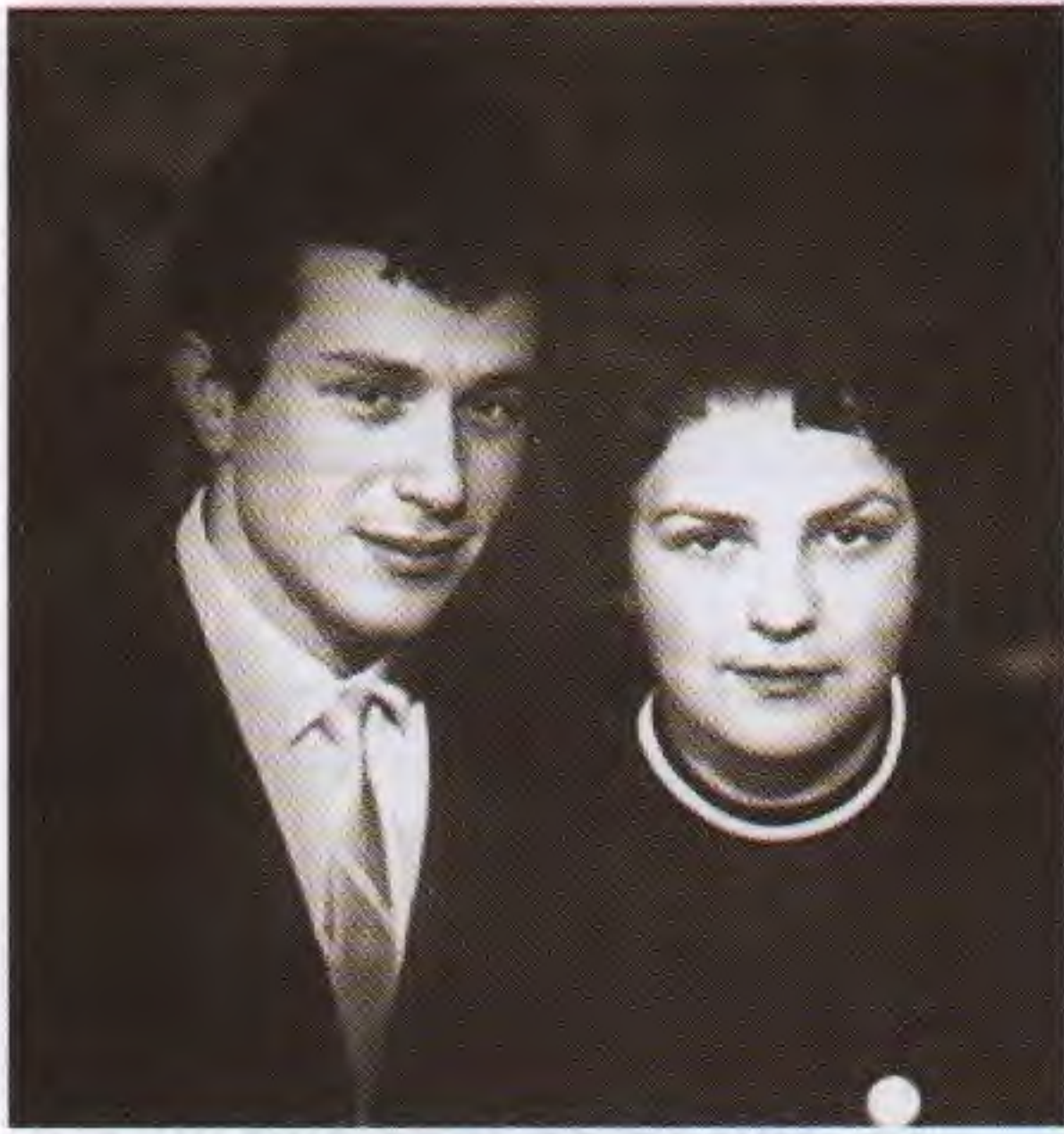
↑ Все только начиналось...