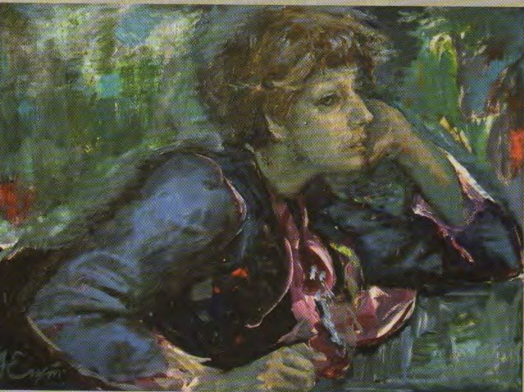
Марина Цветаева. Из цикла «Поэты России». 2001