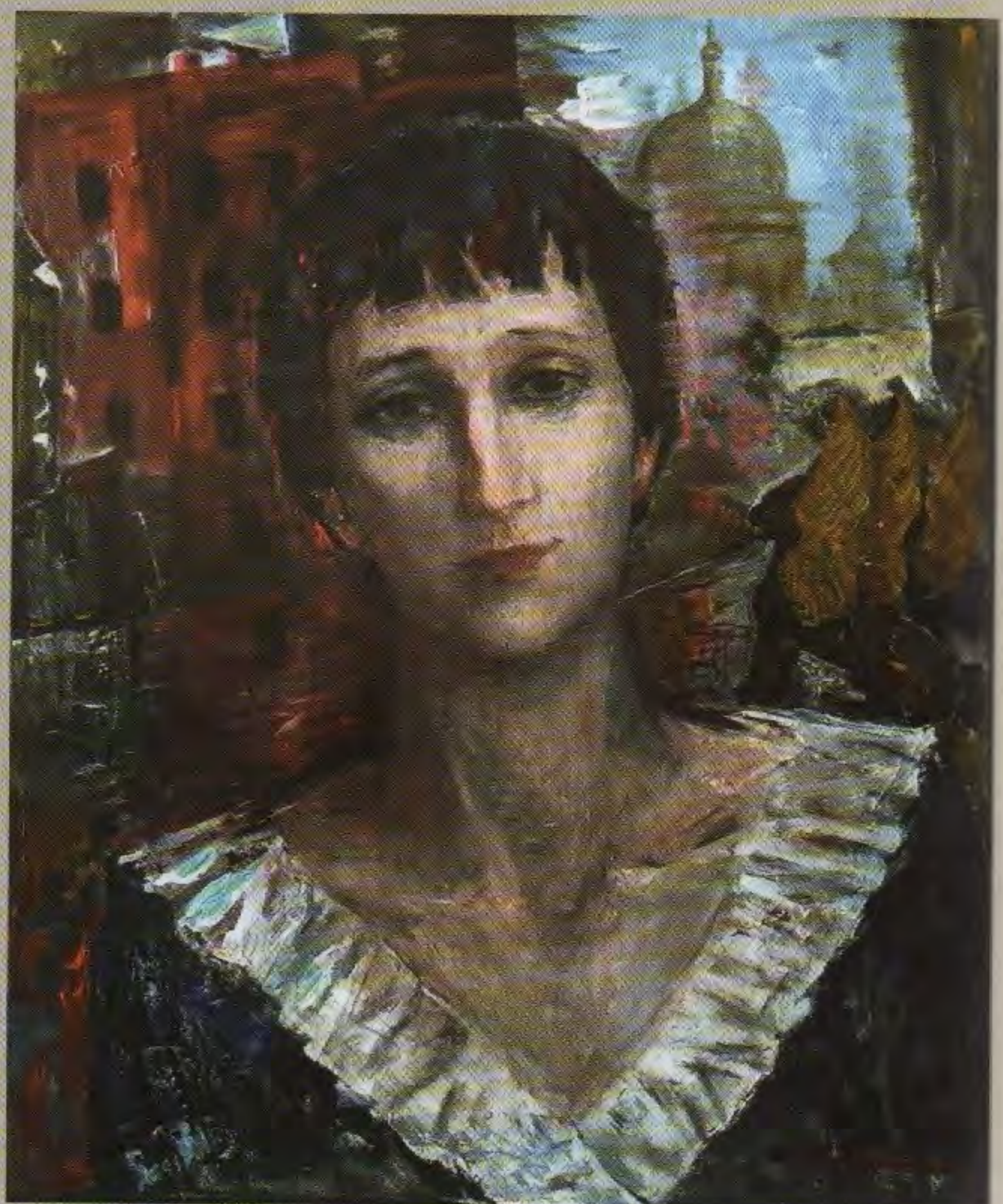
Анна Ахматова. Из цикла «Поэты России». 2016