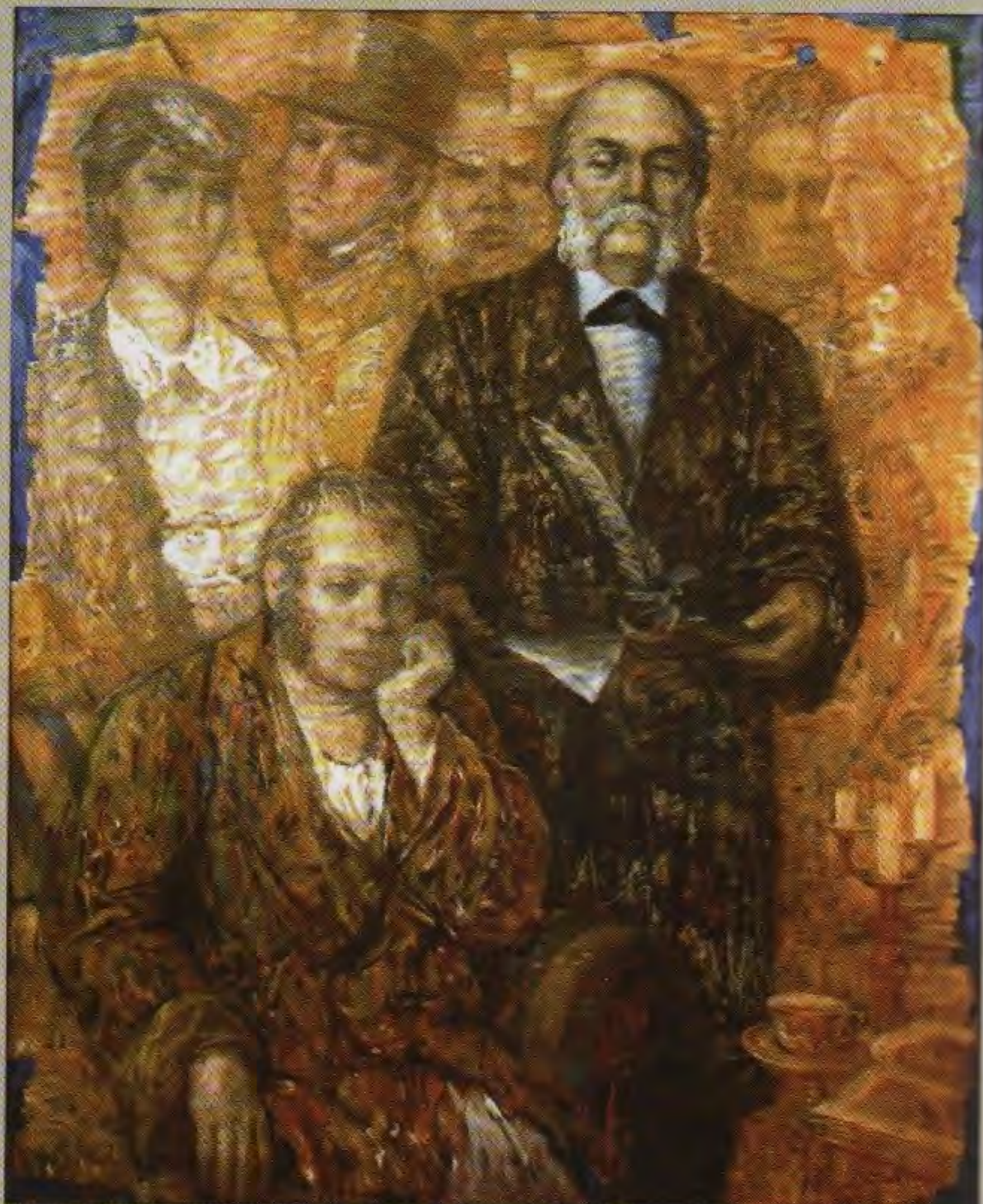
Свой среди своих. Посвящение И.А. Гончарову