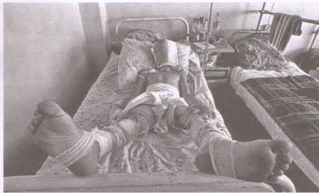
Мальчик в ожоговом отделении

В музее «Симбирская фотография» экспонировалась выставка Владимира Ламзина.