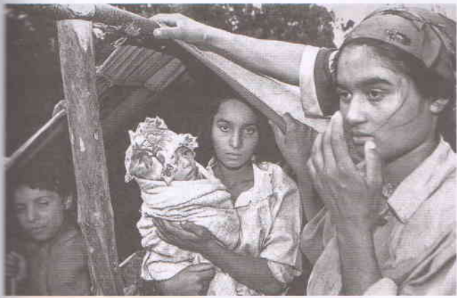
В цыганском таборе