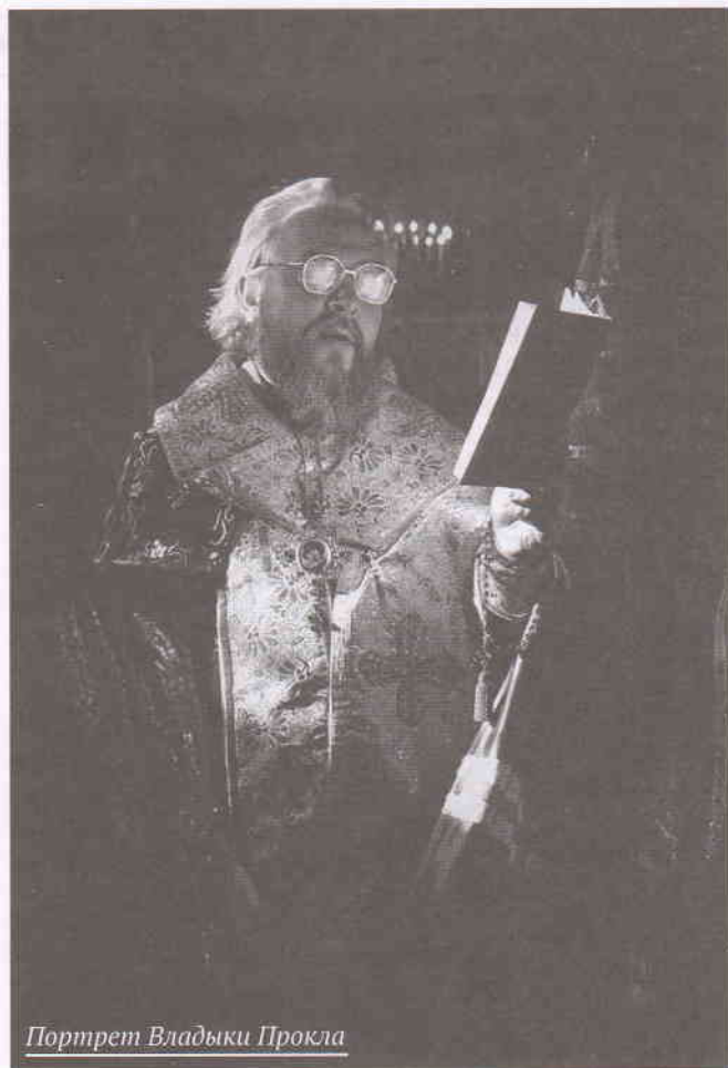
Портрет Владыки Прокла