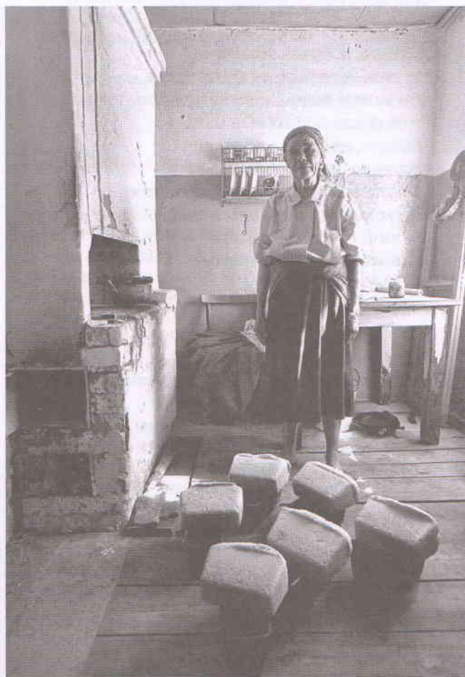
Хлеб наш насущный...(с. Карабаевка)