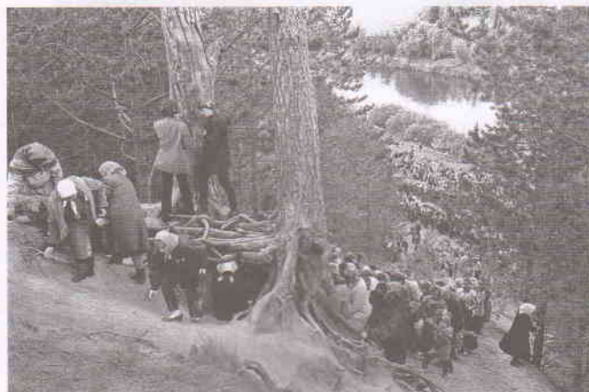
Великорецкий Крестный ход. Кировская область. 2000 год