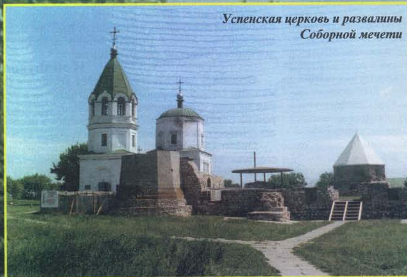
Успенская церковь и развалины Соборной мечети