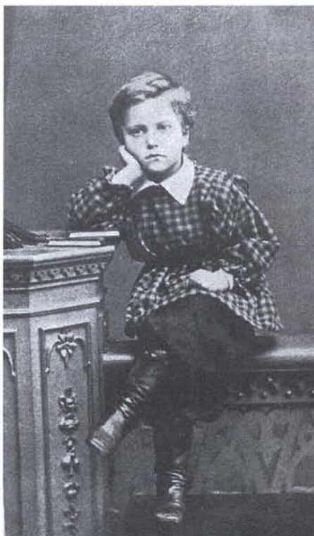
Валентин Серов в возрасте 8 лет

Спустя два года, когда голод пошёл на спад, Валентина Семёновна, оставаясь всё в том же Судосево, приступила к воплощению своей давней мечты. Она привезла рояль, книги, ноты и всё, что нужно для эстетического образования крестьян, и начала открывать в соседних сёлах одну за другой школы, где наряду с грамотой приглашённые учителя под её руководством приобщали детей к музыкальному и театральному искусству. В самом Судосево подвизница создала труппу из крестьян, собрав в неё около сорока человек, репетируя с