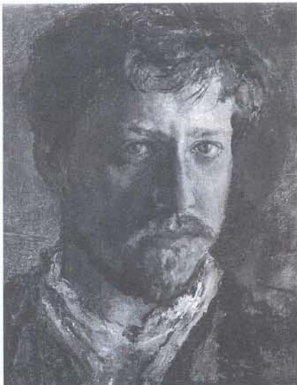
Валентин Серов. Автопортрет