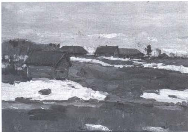
В. Серов. «Деревня на воде»