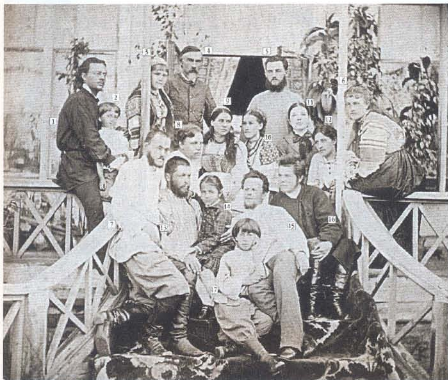
Семейное окружение Хованских-Трубниковых. Архангельское, 1880