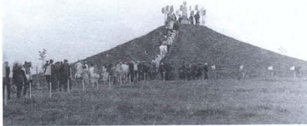
Курган Славы. Могилевская область