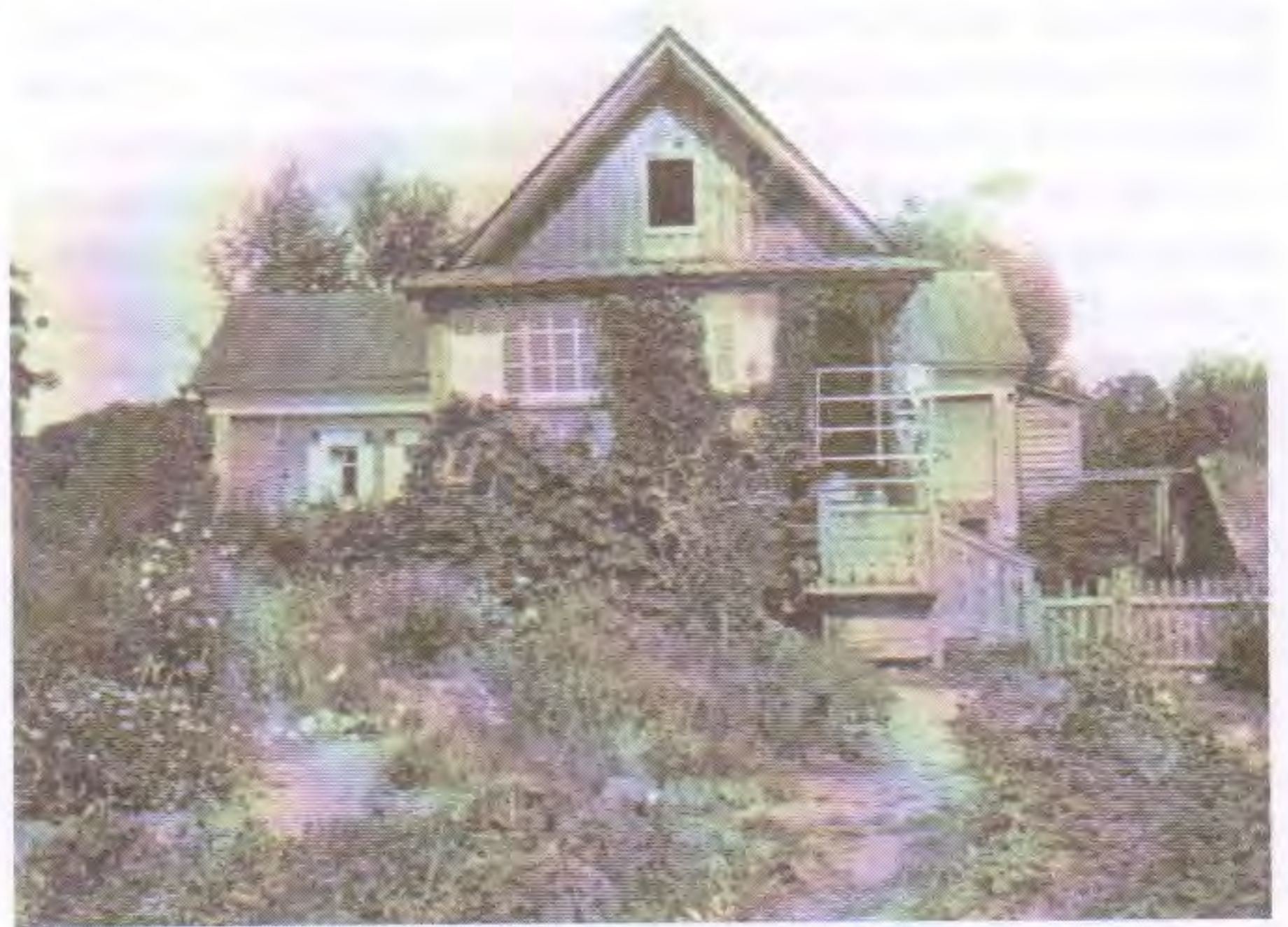
Дом в Дулебино. Фото из фондов Озерского краеведческого музея им. А.П. Дорониной