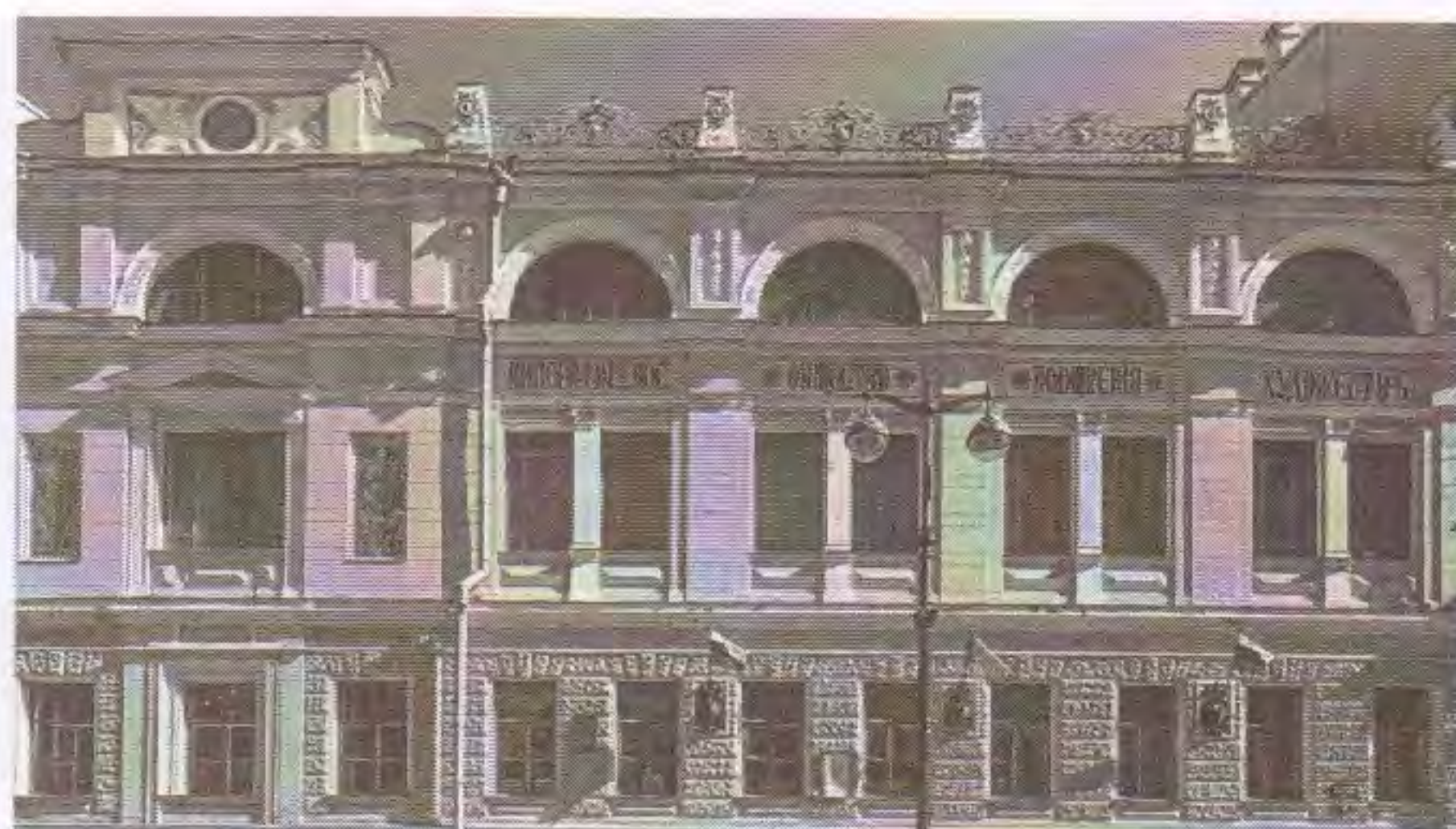
Санкт-Петербург. Здание Общества поощрения художеств. (ул. Большая Морская, 38 – наб.р. Мойки, 83)

Имея широкие связи в художественных кругах, Григорович привлекал к преподаванию в Рихельской школе при Обществе лучших художников того времени, среди которых был, к примеру,