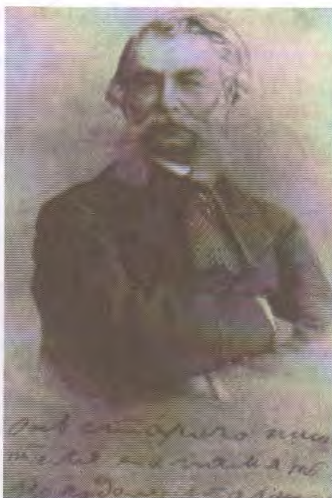
Д.В. Григорович. Фотография с дарственной надписью Чехову: «От старого писателя на память молодому таланту». 1886

После почти тридцатилетнего перерыва Григорович вновь возвращается к литературному творчеству. В свет выходит его пронзительная повесть «Гуттаперчевый мальчик» (1883), которая и поныне числится в классике детского чтения. Трагическая судьба маленького сироты, ставшего цирковым акробатом, не оставила равнодушным ни школьника, ни взрослого. Истинная доброта и ледяное равнодушие, лишения одних и довольство других, светлое и тёмное, добро и зло – вот основные мотивы повести. Произведение переиздавалось множество раз и переводилось на иностранные языки. Именно детские образы позволили Д.В. Григоровичу остро раскрыть тему трагизма судьбы народа в условиях крепостнической России, поскольку именно перед детьми общество несет нравственную ответственность и именно дети – залог будущего. Поэтому произведение современно и сегодня. В 1957 году повесть была экранизирована, и все мы помним яркие образы, созданные прославленными мастерами прошлого: Алексей Грибов (Клоун Эдвардс), Михаил Названов (акробат Беккер), Андрей Попов (граф), Марианна Стриженова (графиня), Иван Коваль-Самборский (директор цирка).