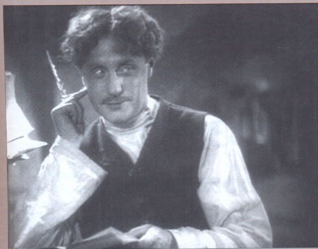
Кадры из кинофильма «Гроза» 1934 года