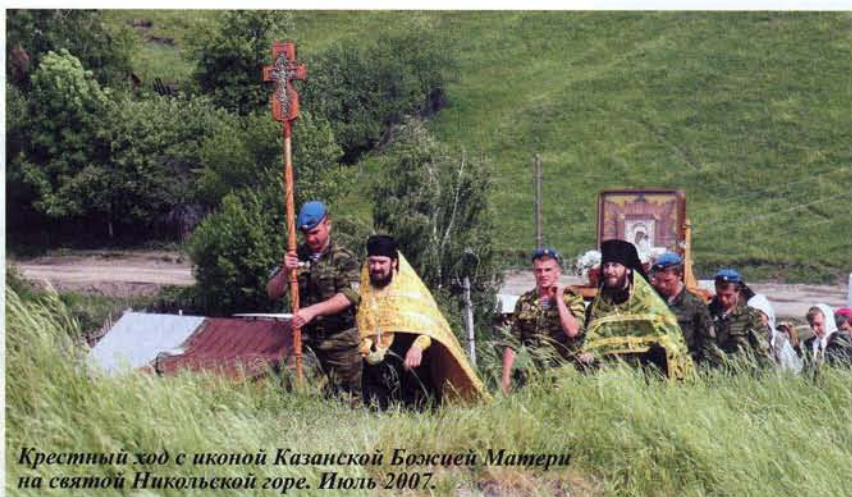
Крестный ход с иконой Казанской Божией Матери на святой Никольской горе. Июль 2007.