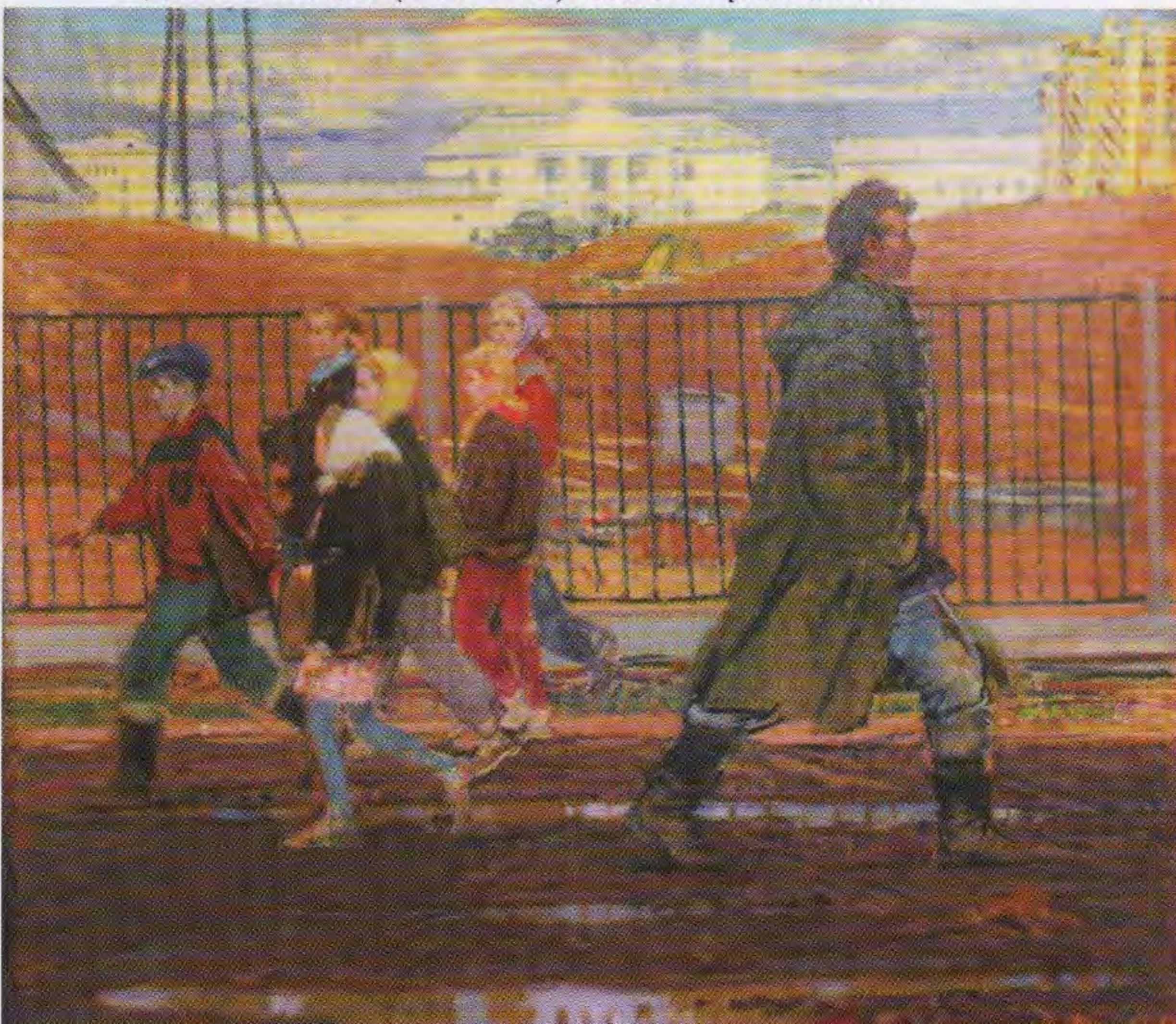
• Д.К. Мочальский (1908–1988). Совхоз строится. 1973

Целая подборка из девяти картин народного художника РСФСР Ивана Сорокина обогатила музейное собрание. Приоритетным в творчестве мастера стал городской пейзаж, который исполнен в лучших традициях московской живописной школы и отличается большой культурой цвета и свободного, трепетного письма. В яркую плеяду «шестидесятников» вошел и народный художник СССР, лауреат Государственных премий Петр Оссовский. Особую роль в формировании Оссовского как художника сыграл живописец и талантливый педагог С. Герасимов, в мастерской которого занимался Оссовский. Герасимов поощрял стремление молодых художников изображать жизнь без прикрас и фальшивого блеска. Пейзажи, натюрморты, портреты Оссовского характеризуются остротой увиденного, яркими и открытыми эмоциями, выраженными максимально лаконичными художественными средствами. Таковы его пейзажи «Каменный мостик» (1981) и «Деревня Медзибродзе» (1975) с видами старых поселений, немного хаотичных в своей застройке, но сохранивших национальный дух и художественное своеобразие страны. С новым поступлением наш музей стал обладателем двенадцати картин П. Оссовского.