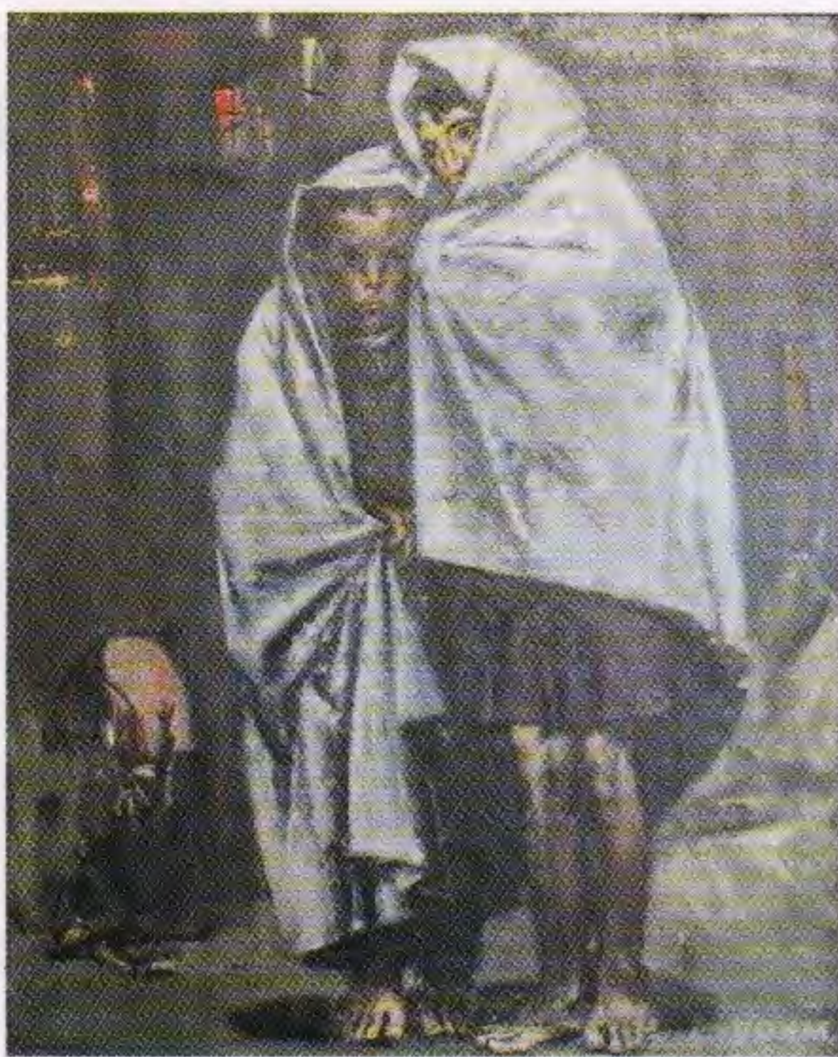
• Е.Е. Моисеенко (1916–1988). Дети войны. Ливан. 1984