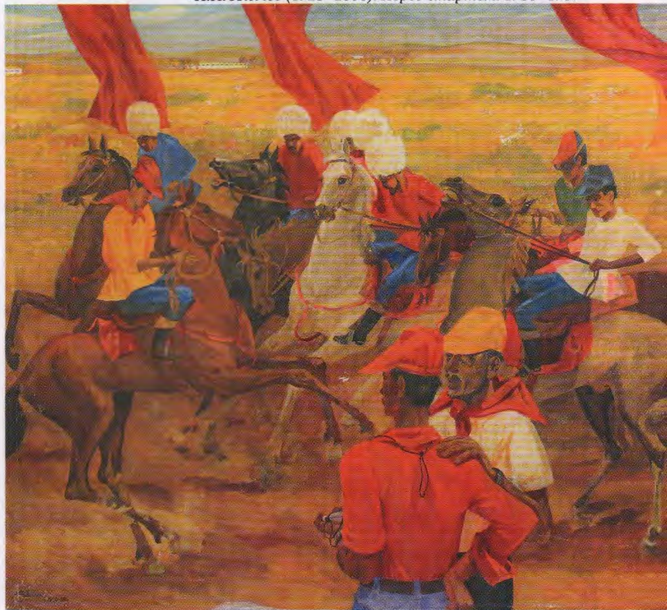
И. Н. Клычев (1923–2006). Перед стартом. 1986–1987