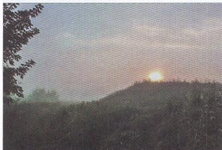
Река Сура у Бахметьевки