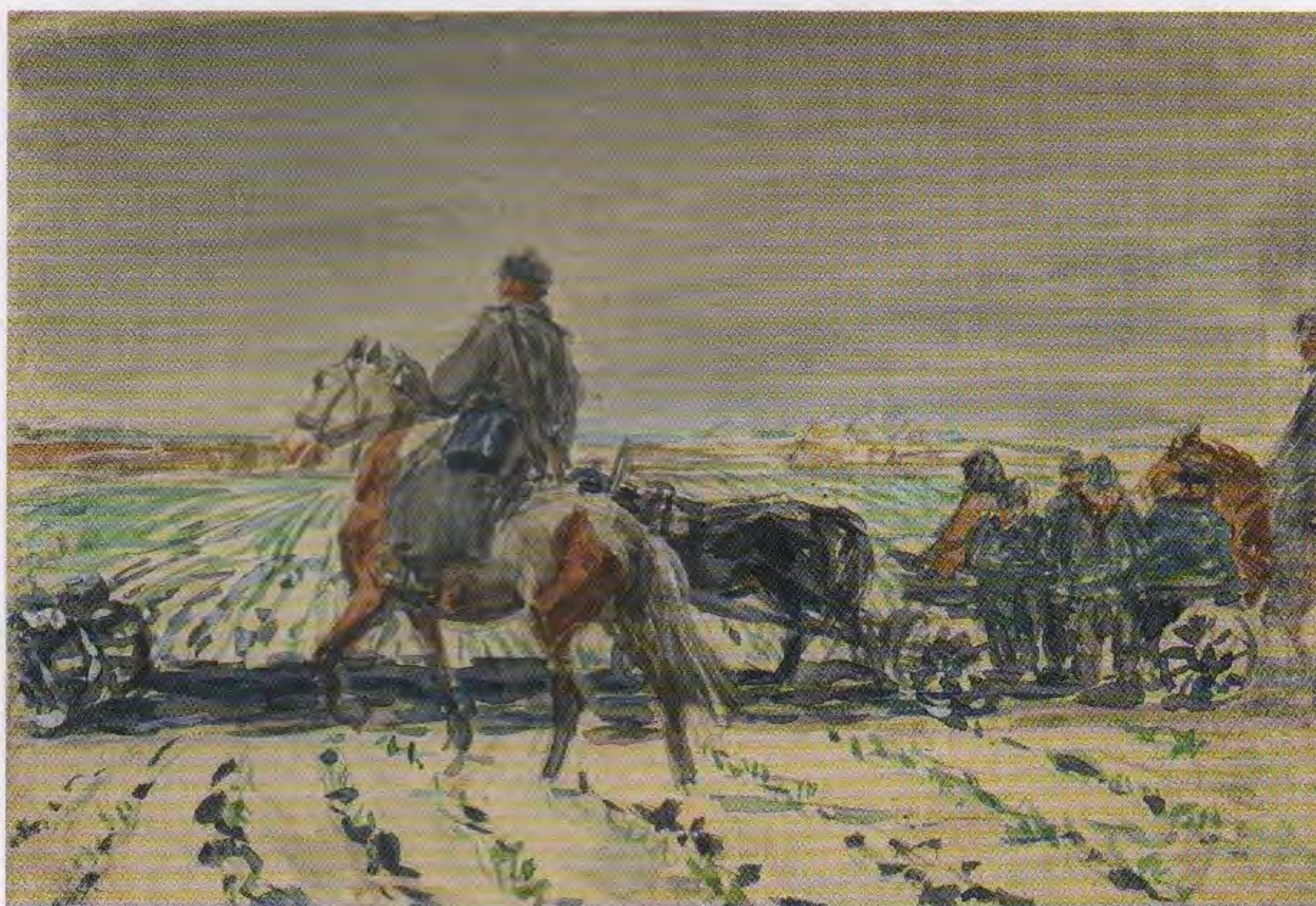
А.А. Пластов. Пленных везут . 1942. Б., акв., белила; 10,1x14,9. Собрание семьи Пластовых

«Марш на восток». Тем не менее, как оказалось, замысел создать картину с пленными родился у художника ещё до командировки на фронт. В семье живописца сохранился небольшой акварельный эскиз, датированный 1942 годом, – «Пленных везут», где военнопленные едут на телеге под конвоем советских конников на поле озимых, припорошенных снегом. На эскизе погода напоминает ноябрь-