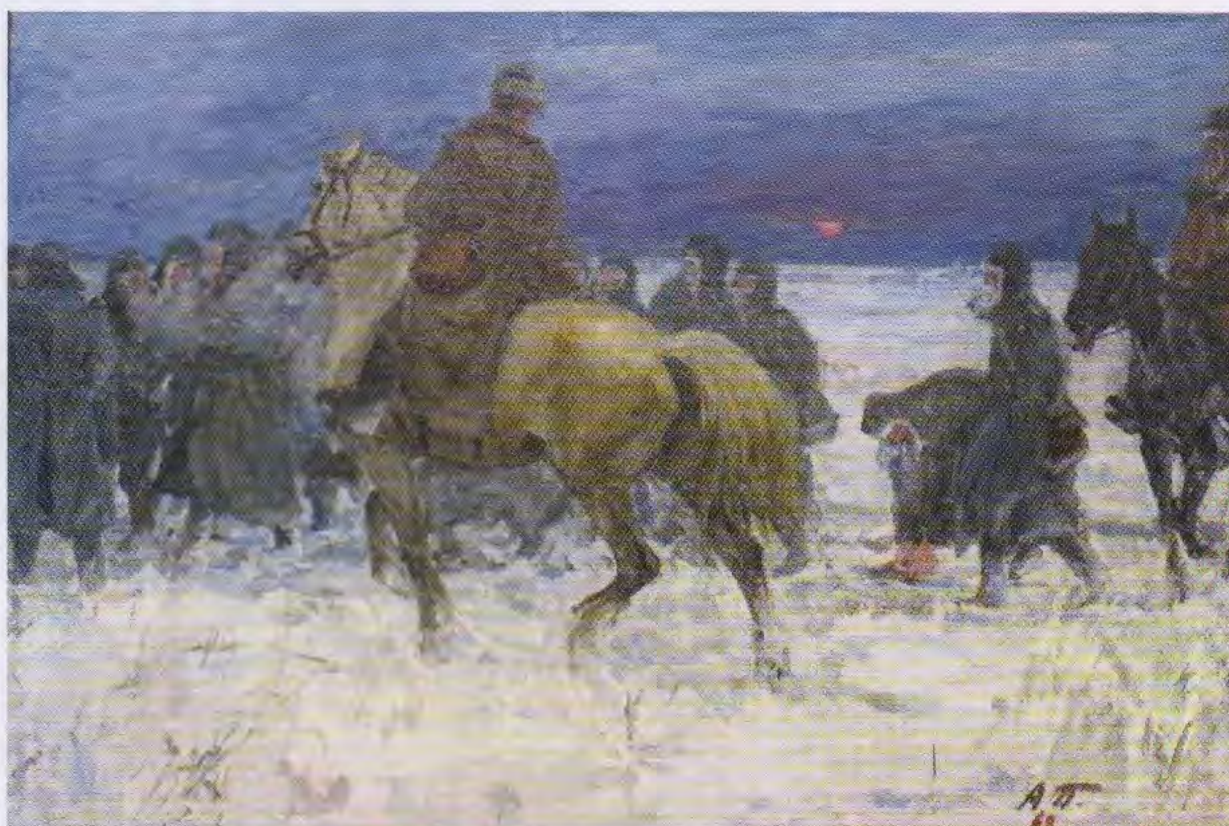
А.А. Пластов. Марш на восток . 1968. Холст, масло; 80x120. УОХМ

Очевидно, колонны немецких военнопленных были одним из самых запоминающихся впечатлений художников под Сталинградом. Поэтому неудивительно, что спустя много лет Пластов написал картину