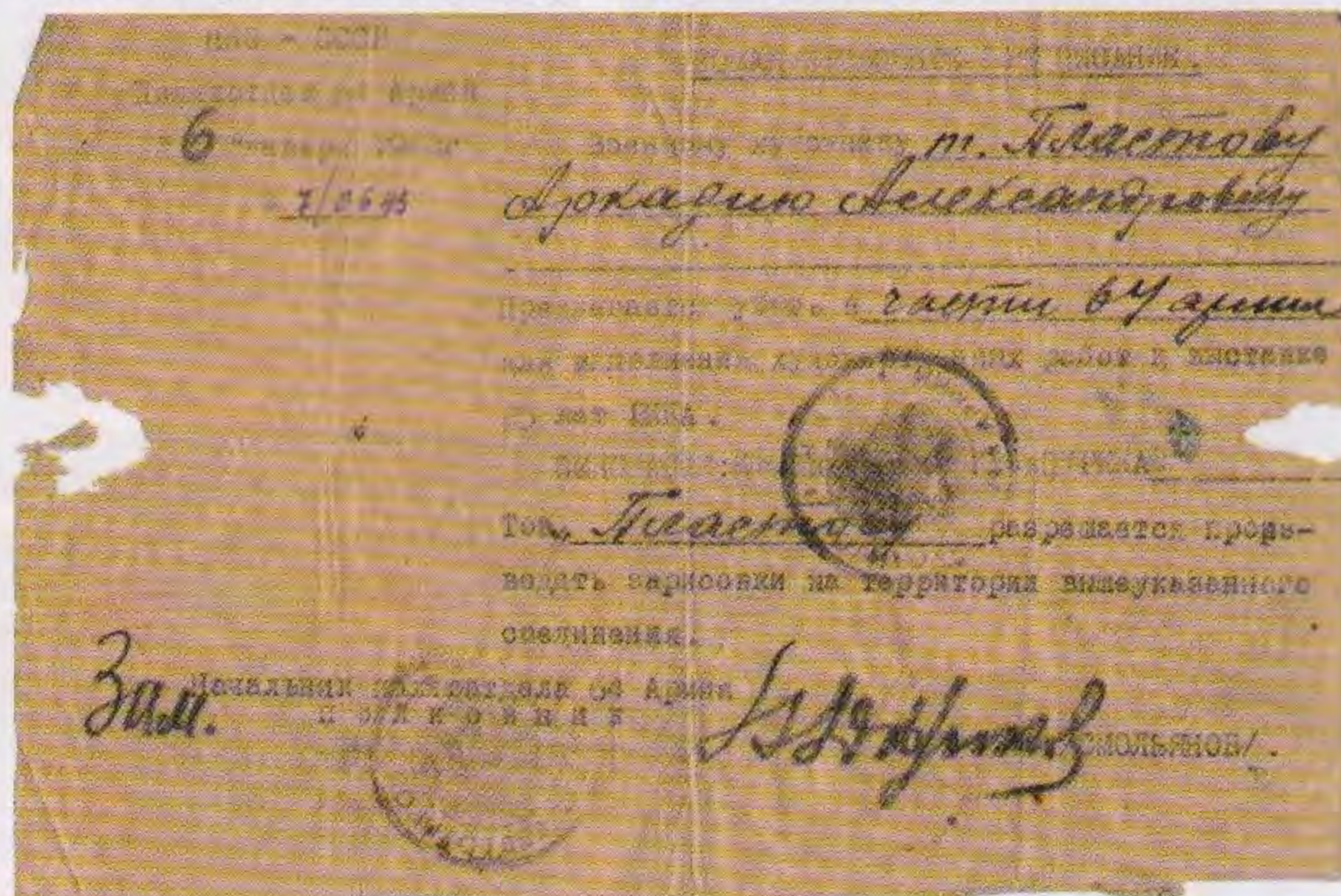
Командировочное предписание в 64-ю армию.