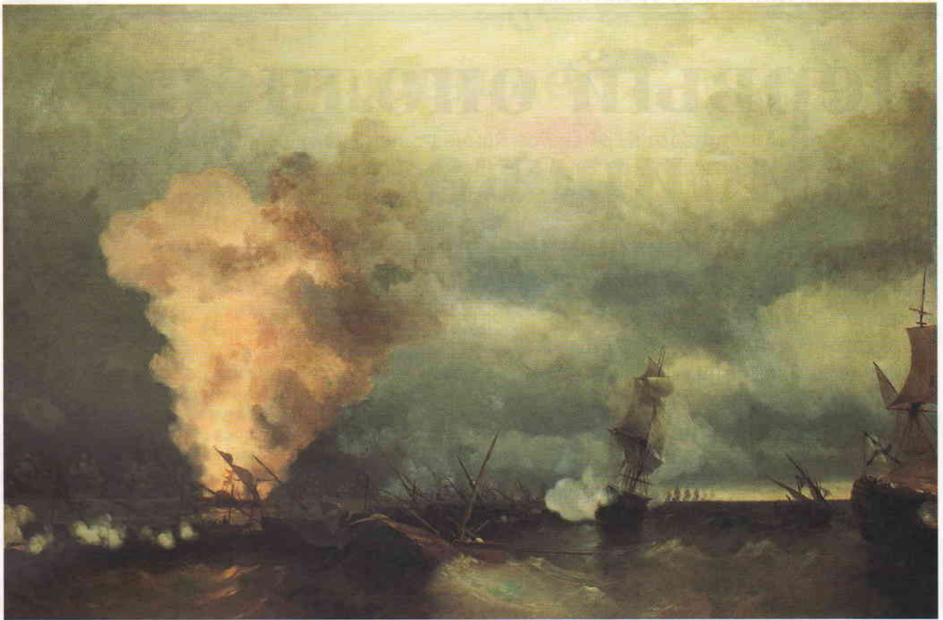
↑ Айвазовский И.К. Морское сражение при Выборге. 1846