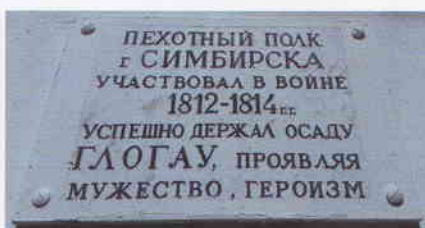
Мемориальная доска о Симбирском ополчении

О героическом участии симбирян в осаде Глогау есть даже мемориальная доска на торце здания бывших Губернских присутственных мест – ныне Ульяновский государственный