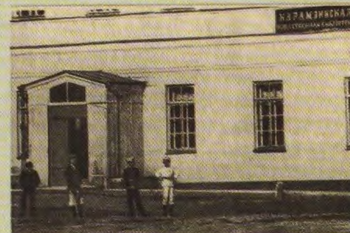
Карамзинская общественная библиотека с нотным отделом. 1880-е годы