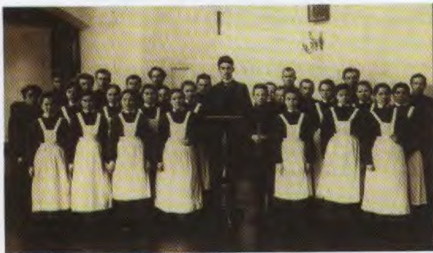
Хор девочек Симбирской чувашской учительской школы. 1911