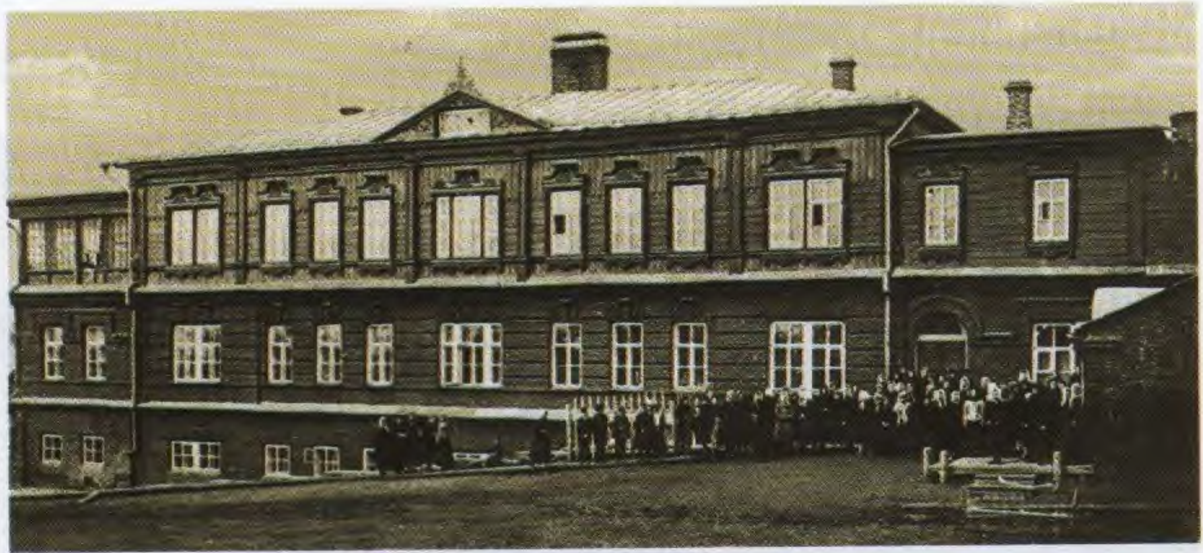
Симбирская чувашская школа

Отлично было поставлено музыкальное образование в кадетском корпусе. Здесь преподавались теория музыки, игра на духовых инструментах, хоровое пение. Для кадетов издавались специальные пособия. Например, в 1882 году преподаватель И.А. Иванов подготовил и издал в Симбирске брошюру «Хрестоматия пения, составленная для кадетов Симбирского кадетского корпуса».