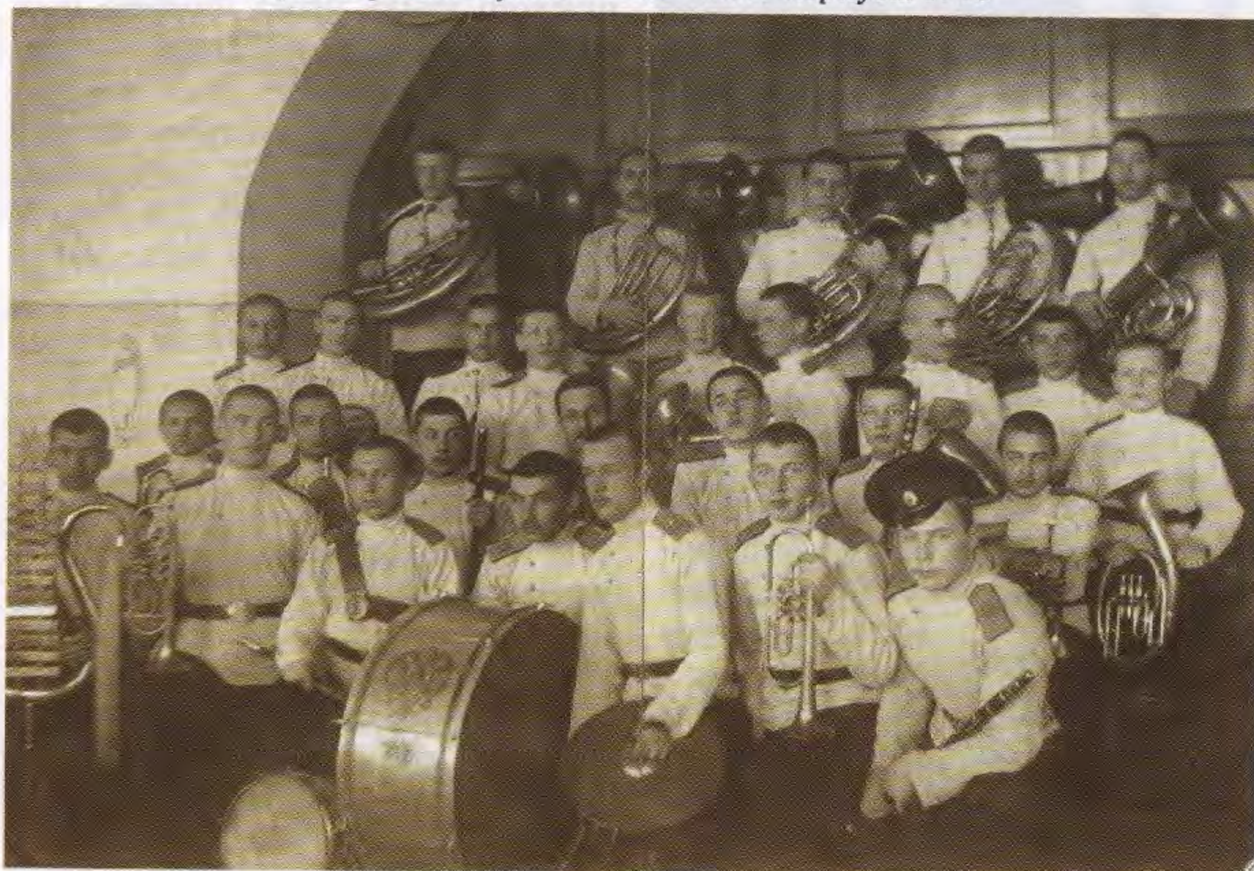
♣ Оркестр Симбирского кадетского корпуса. 1915