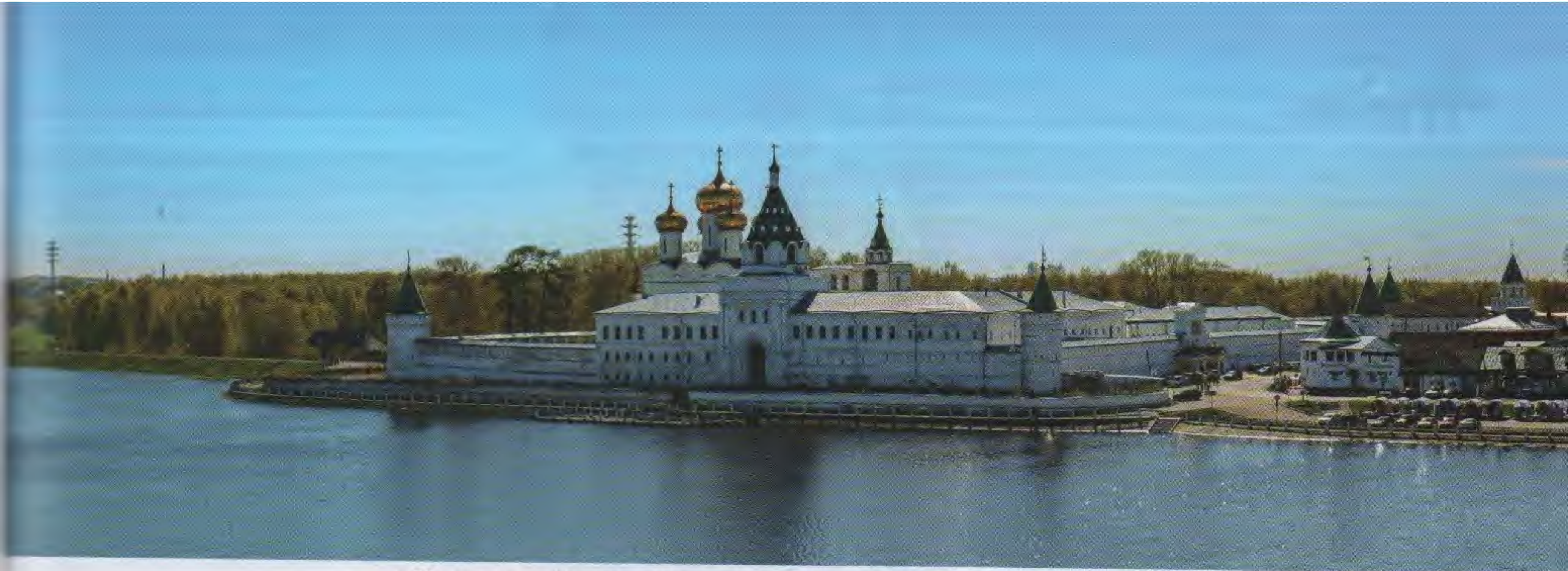
Ипатьевский монастырь – колыбель рода Романовых