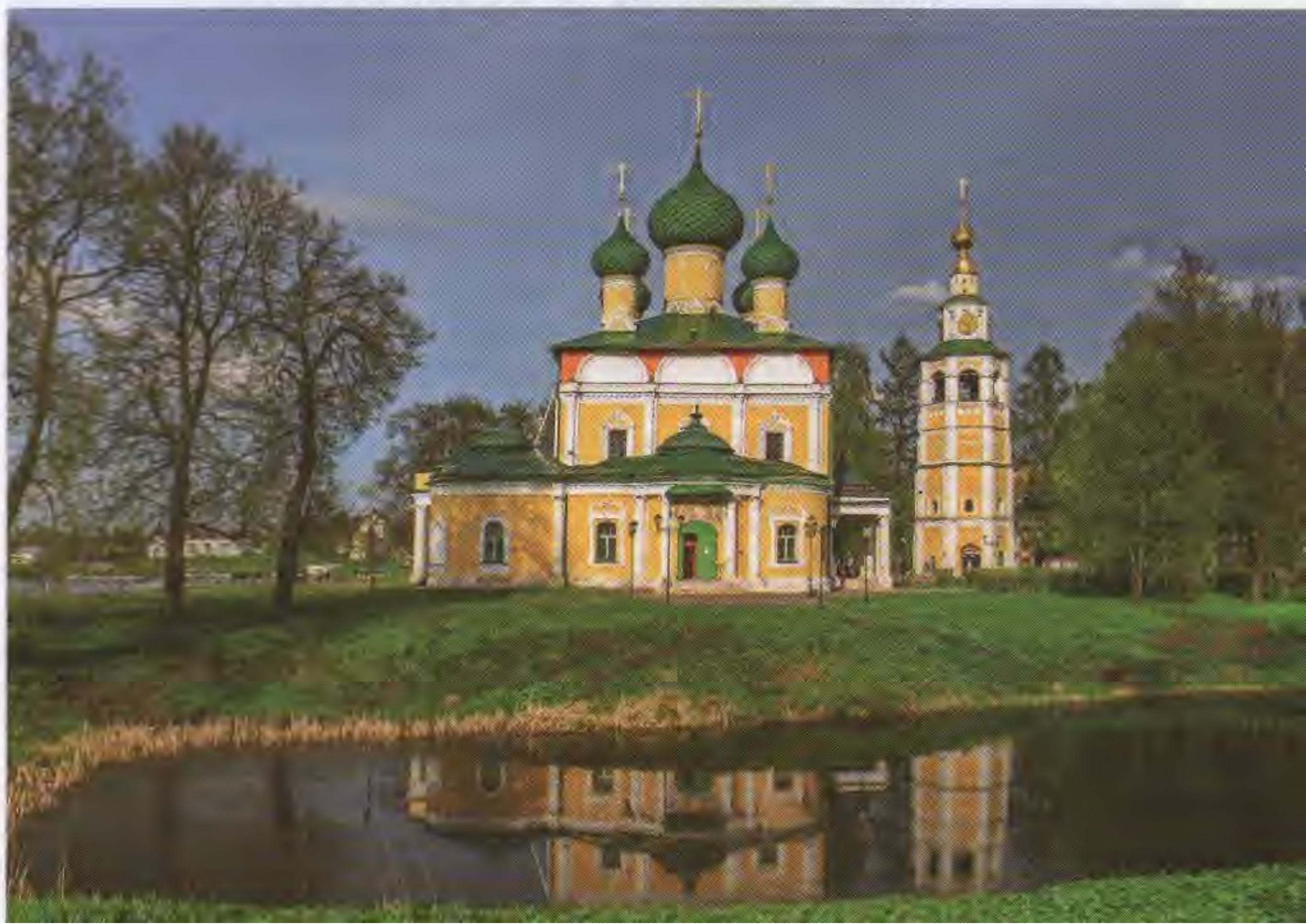
↓ Угличский кремль. Спасо-Преображенский собор

В 1918 году монастырь был передан Угличскому музею древностей. В середине 1930-х годов ансамбль