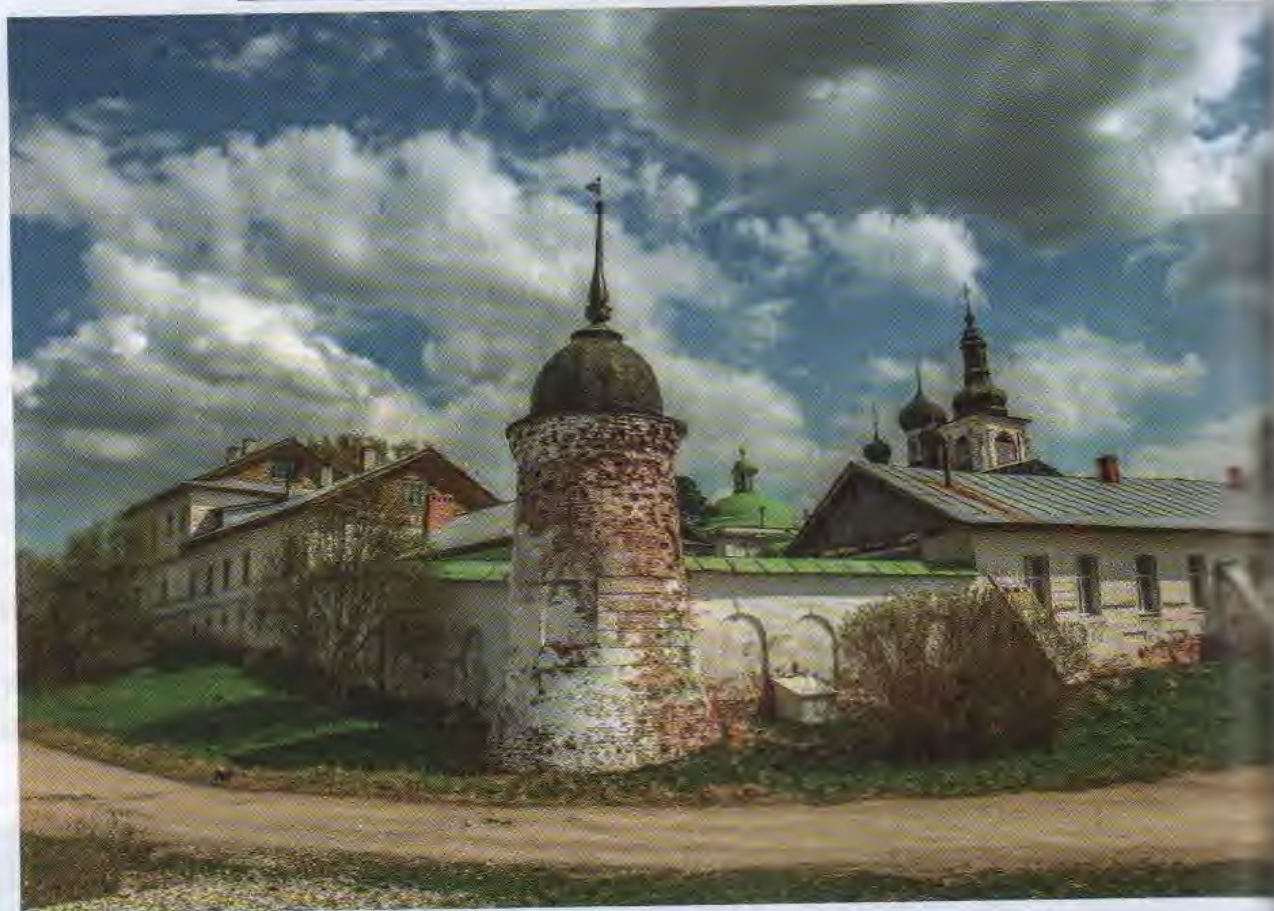
Горицкий Воскресенский женский монастырь

В 1924 году органы советской власти преобразовали обитель в музей краеведения, с 1968 года он именовался как Кирилло-Белозерский музей-заповедник. В 1997 году в безвозмездную аренду РПЦ отданы постройки Малого Иоанновского Горниего монастыря, часть келий Успенского монастыря и церковь Кирилла (1785 г.).