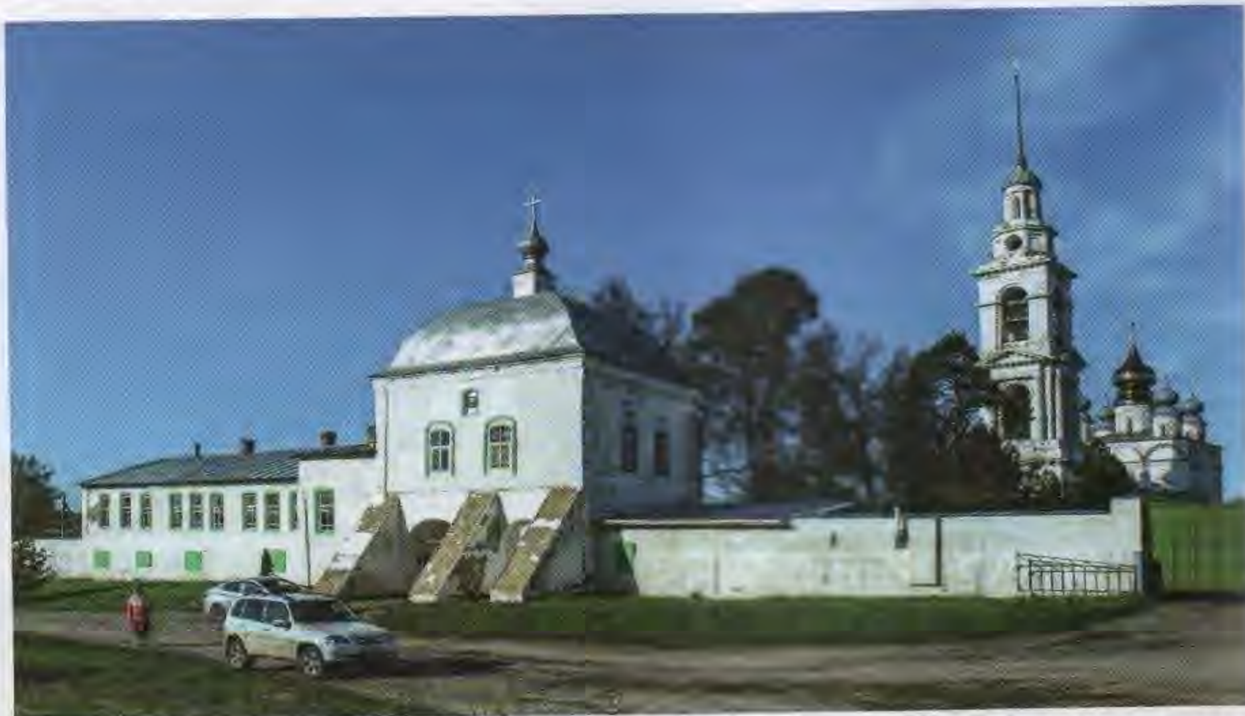
Свято-Никола-Тихонов православный мужской монастырь в селе Тимирязеве

В пяти километрах от Луха находится посёлок Тимирязевский, здесь располагается Никола-Тихонов Лухский мужской монастырь , основанный в 1498 году преподобным Тихоном. В 1930-е годы монастырь был закрыт. Постройки разрушались и уничтожались. В 1995 году началось восстановление обители.