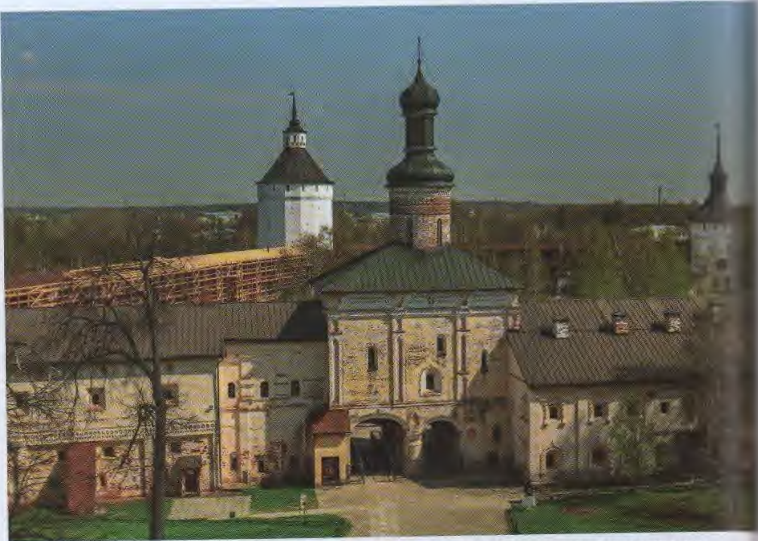
Святые ворота Кирилло-Белозерского мужского монастыря

Вологодская область. Свято-Успенский Кирилло- Белозерский мужской монастырь