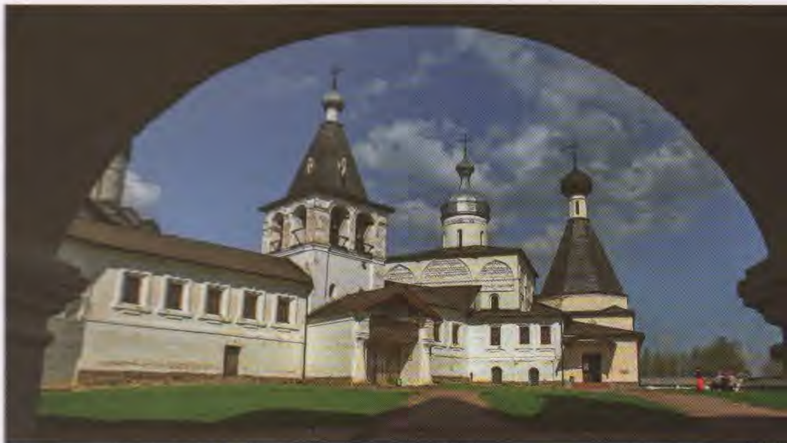
↑ Село Ферапонтово. Ферапонтов-Белозерский монастырь (мужской)

В 1928 году монастырь закрыли. Настоятеля монастыря иеромонаха Григория (Алексеева) сослали в Сибирь, монахов прогнали. С колокольни были сброшены колокола. Долгое время в стенах монастыря находилась колония для несовершеннолетних. В 1987 году расформировали колонию, постройки передали РПЦ. 7 декабря 1987 года Святейшим Патриархом Пименом здесь была учреждена первая в современной России женская обитель.