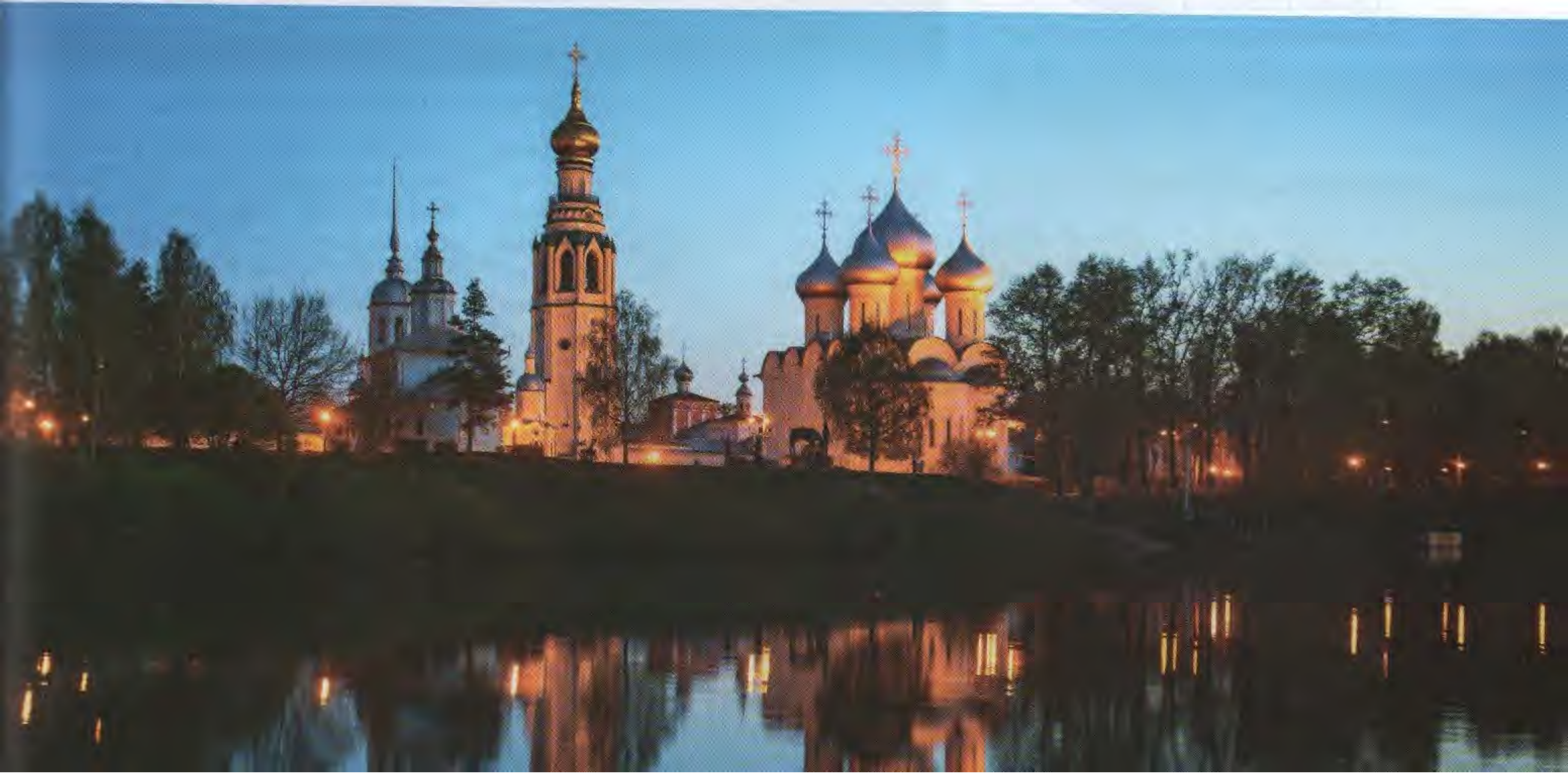
Вечер на реке Вологде

Вологда входит в число городов, обладающих особо ценным историческим наследием. На его территории выявлено 224 памятника истории, архитектуры, культуры, 128 из них взяты под охрану государством.