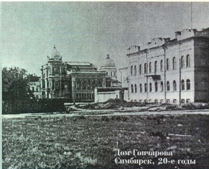
Дом Гончарова Симбирск, 20-е годы

Кто из ульяновцев и гостей города не бывал на знаменитом Венце? Кто не любовался отсюда причудливыми волжскими окрестностями? А кто не пленялся красотой и стройностью Гончаровского Дома, самого, пожалуй, достойного архитектурного творения в городе? Сегодня здесь разместились два музея - Краеведческий и Художественный, сохранившие бесценные памятники прошлого. Недавно Художественный музей отметил 100-летие своей коллекции. Это событие не прошло незамеченным: познакомившись с юбилейной выставкой, общественность города, журналисты заговорили о музее с еще большим восхищением и гордостью. Мы же предлагаем читателям познакомиться с непростой историей строительства Гончаровского Дома и первыми уникальными экспонатами Художественного музея.