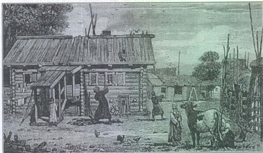
Татарское село. Гравюра XIX века

Магометанское многоженство к татарам не привилось, по всей вероятности, вследствие экономического затруднения содержать несколько