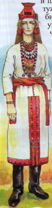
рис. Е. Худяковой

Сложена изба мордовская из доброго толстого хозяйственного леса, благо мордвин не любит скучиться на то, чтобы обладать свое жилище на долгое время. Тот час заметно, что хозяин не пришел сюда на время, для того чтобы урвать и снова искать новых мест, а выстроился сыздавна надолго, рассчитывая так, чтобы внуки его все там же в раз излюбленном месте сидели и от него кормились.