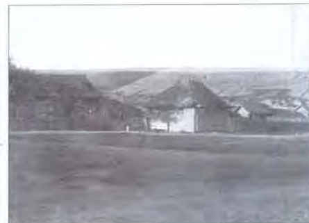
Село Кайбелы (Крестово-Городище). 1952

Старую Майну, Кремёнки, Ивановку, Динганаево (Енганаево), которые располагались на территории современных Старомайнского и Чердаклинского районов Ульяновской области. Из них два населённых пункта – Енганаево и Ивановка – находились за пределами зоны затопления, и, вероятно, были выбраны ошибочно (или считалось, что они тоже частично будут затоплены?). Зато благодаря этому до нас дошло изображение ныне утраченной мечети в Енганаево (современная мечеть была построена в 1990 году).