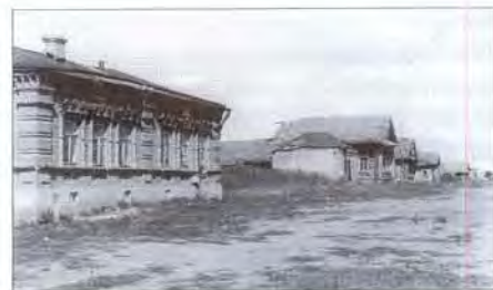
Деревня Старый Урень. Часть улицы. 1952