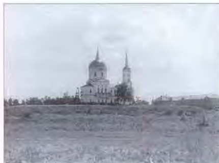
Село Головкино (вид с берега). 1952