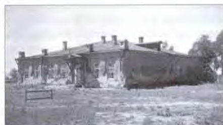
Село Тургенево. Дом декабриста Н.И. Тургенева. 1952

без хотя бы небольшого письменного отчёта. Судя по фотоснимкам, экспедиция посетила одиннадцать поселений: Тургенево, Крестово-Городище (Кайбелы), Петровку, Алексеевку, Архангельское, Старый Урень, Головкино,