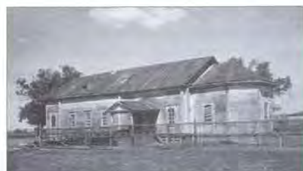
Село Тургенево. Бывшая церковь (клуб). 1952