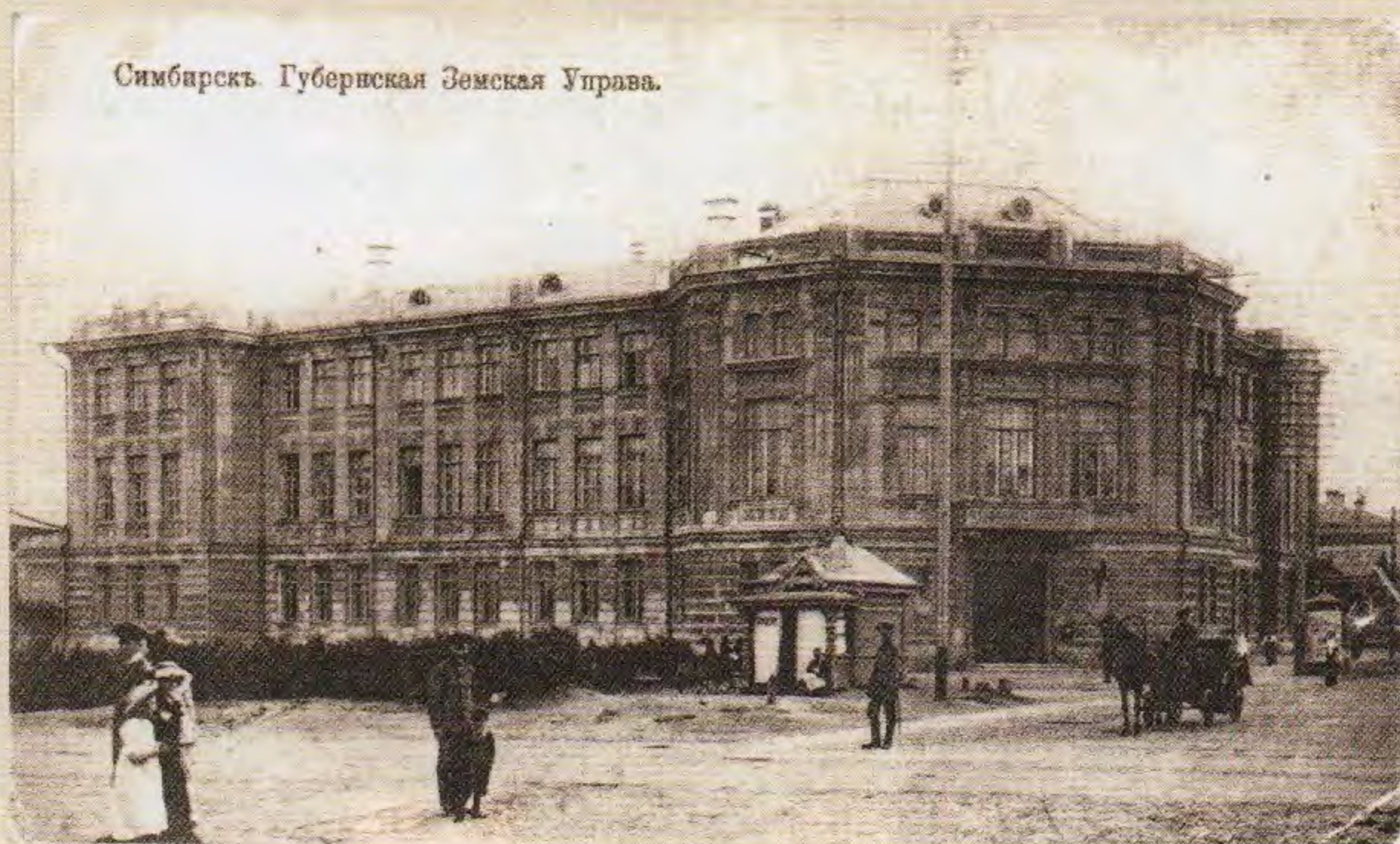
Симбирскъ. Губернская Земская Управа.

З емские (местные) налоги, или земские сборы , существовали наряду с государственными прямыми налогами, взимаемыми с дохода и имущества. Земские налоги были главным источником дохода земств. Поступления по этим сборам составляли свыше двух третей доходов земств и использовались на содержание земских органов самоуправления, полиции, школ, больниц и т. п. Около 70% поступлений по земским сборам давали налоги с земель.