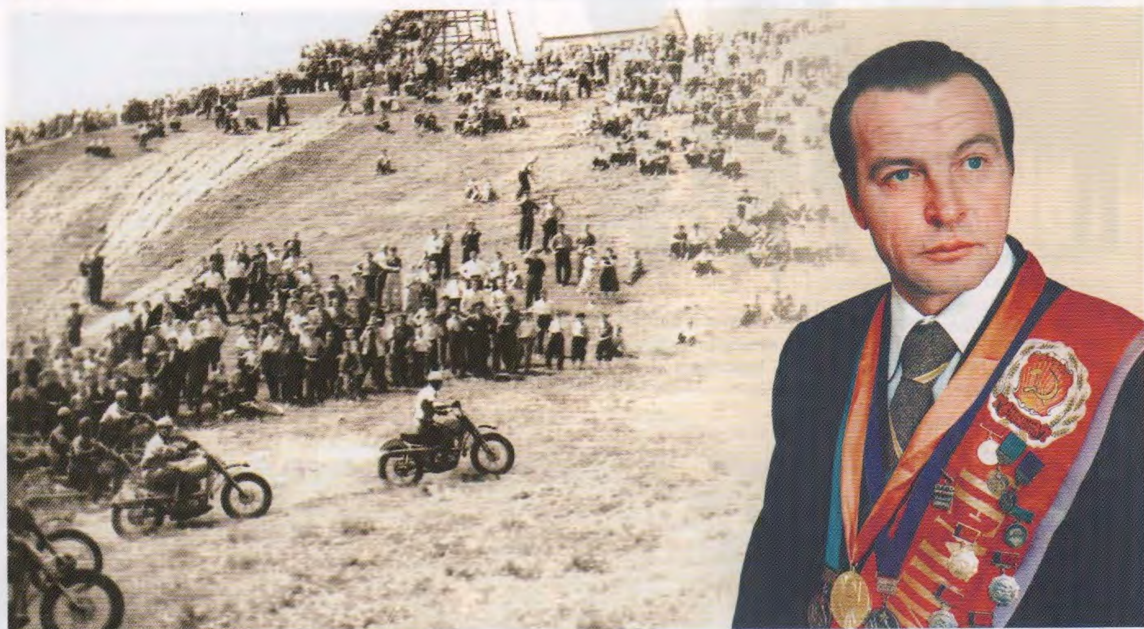
Соревнования по мотокроссу в Винновской роще