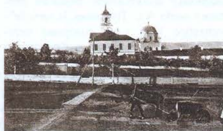
Отделение Государственного банка и Общественный союз