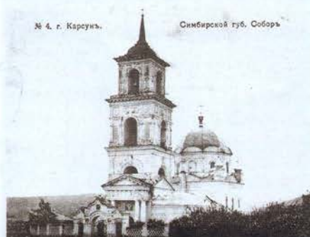
Собор Рождества Христова. Снесён в 1930-х