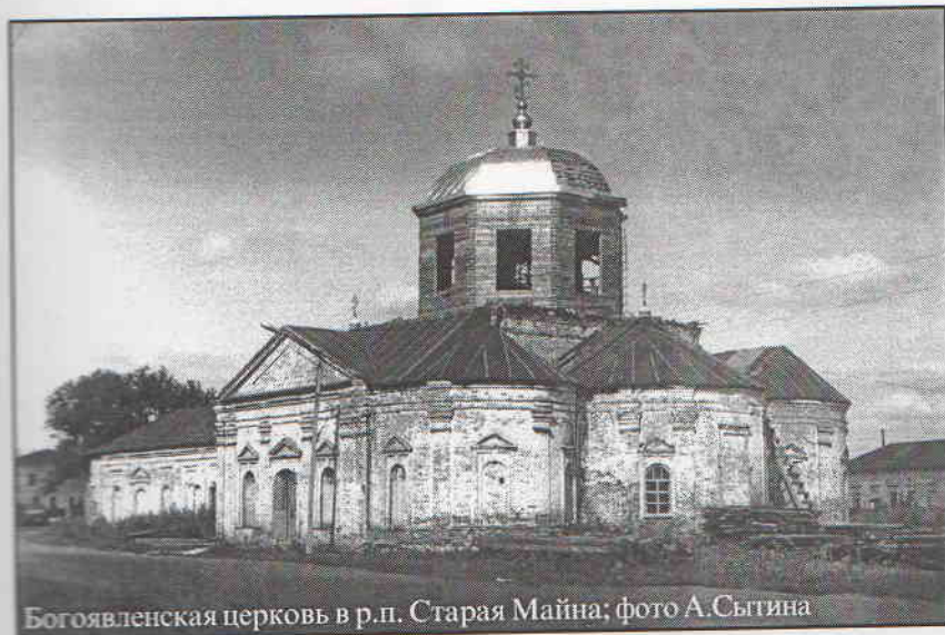
Богоявленская церковь в р.п. Старая Майна

Достаточно было ошибок на нашем веку – пора собирать камни.