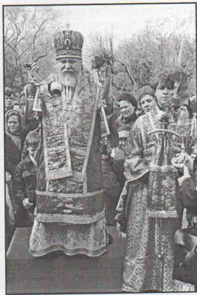
Архиепископ Ульяновский и Мелекесский владыка Прокл на праздничном богослужении. 2001 г.

Церкви и монастыри своеобразной сетью покрывали всю территорию России девятнадцатого века, создавая особое духовное пространство, особую атмосферу жизни. Религия пронизывала всю систему крестьянского быта: время определялось по колокольному звону, по началу служб, все основные элементы человеческой жизни связывались с церковью: крещение, свадьбы, похороны. Кроме того, церковь давала образование основной массе крестьянского населения, и благодаря этому сохраняла свою особую власть и нравственное влияние.