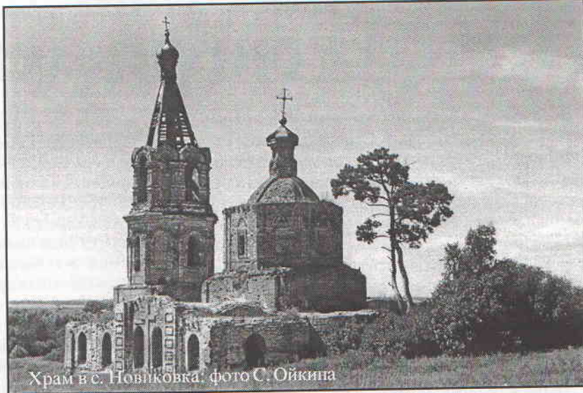
Храм в с. Новиковка

К сожалению, внешний облик утраченных церквей можно увидеть лишь на дореволюционных открытках и акварелях, а также в фотоальбоме «Симбирск – 350». А многие ценные памятники архитектуры – чудом сохранившиеся храмы в селах Ульяновской области – и поныне подвержены разрушению.