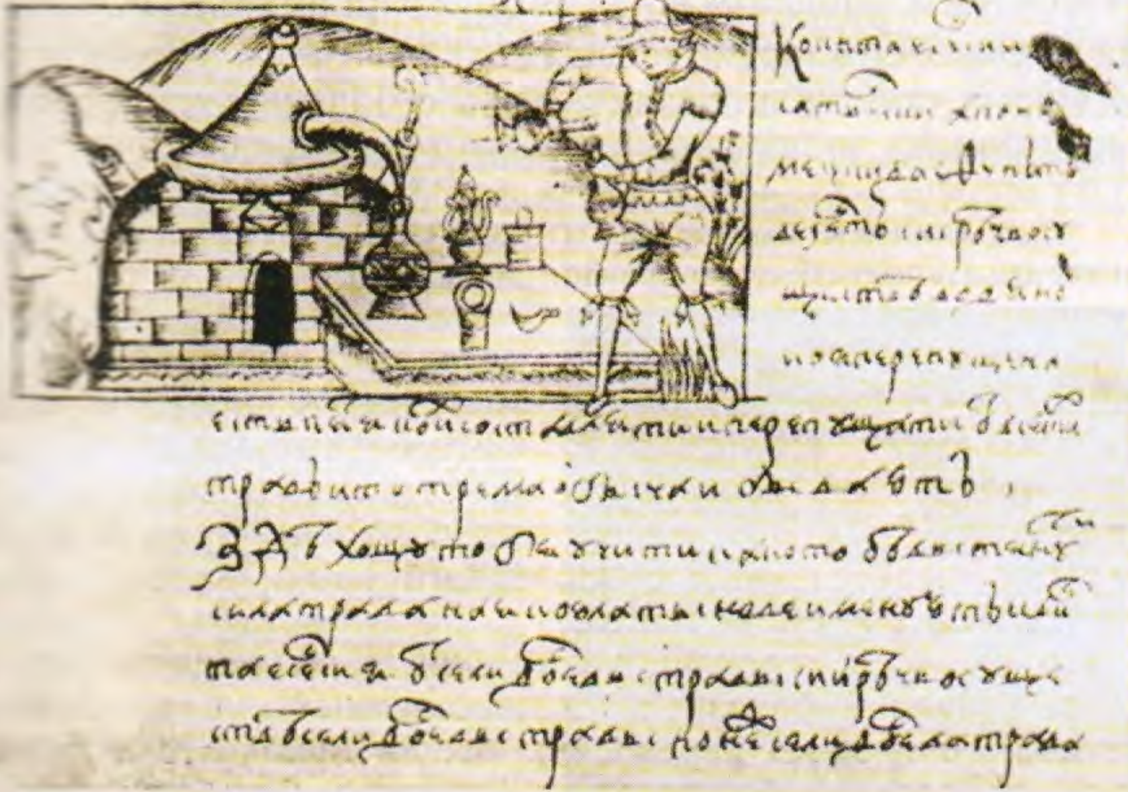
«Аптекарь» за работой в «пропускной палате» русской аптеки. Иллюстрация к рукописи по списку XVII века. Из книги Богоявленского Н.А. Древнерусское врачевание в XI–XVII веках. М. 1960

В Аптекарской палате о пропускании царских консультаций... (рукопись XVII века)