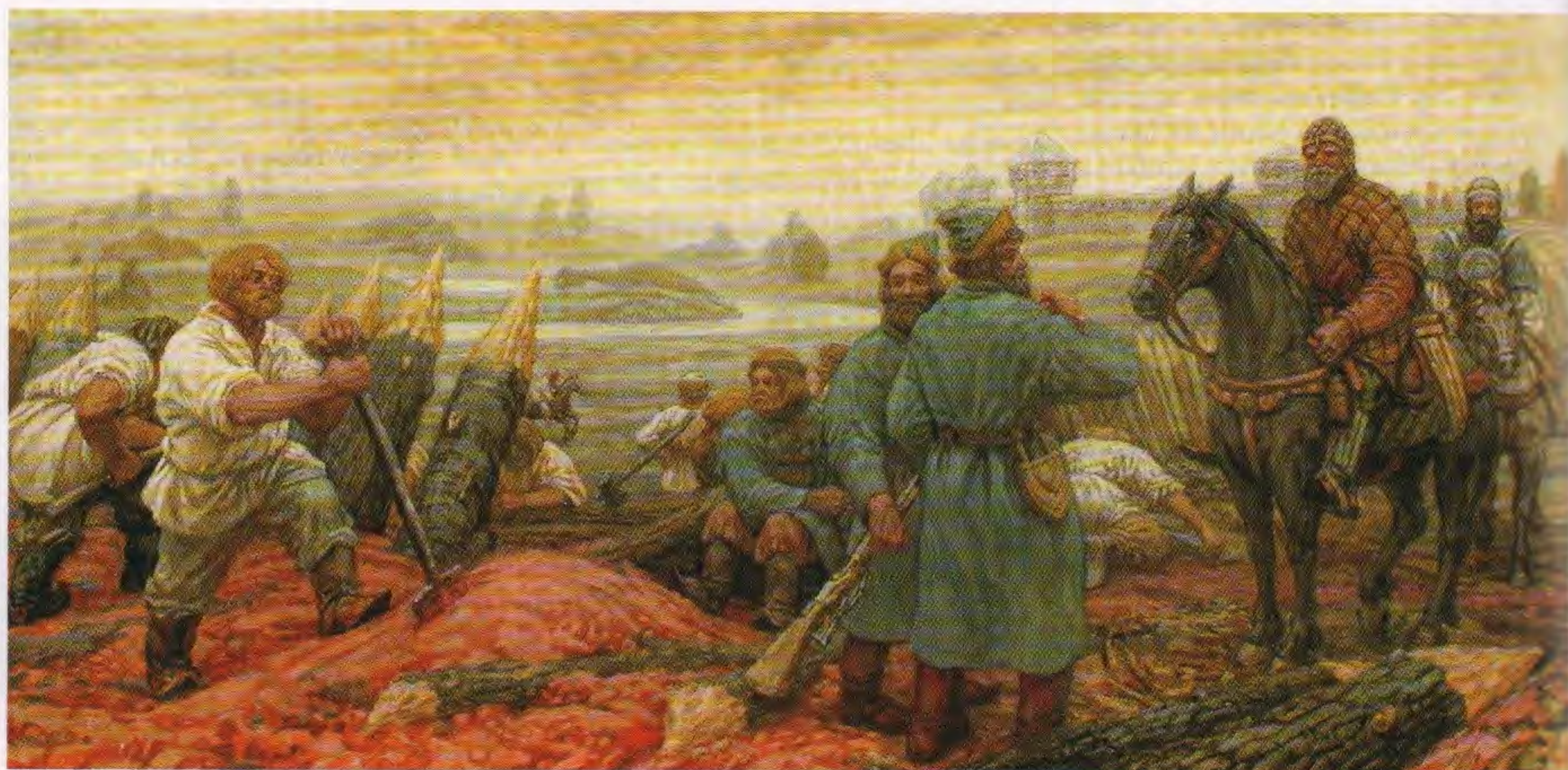
↑ Русская засечная черта. Южный рубеж. Художник Макс Пресняков, 2010

Продолжалось и укрепление Симбирской засечной черты: «Да прежеж Уреня и Карсуни новая засека засечена в прошлом во 176 году». Проводился ремонт старых укреплений: «Да прежеж Синбирска и Юшанска два места горелово и заделано плетнем и насыпано землею в связях дубовых. Да Горелово ж валу меж Юшанска и Тагаева, да заставлено новым тыном».