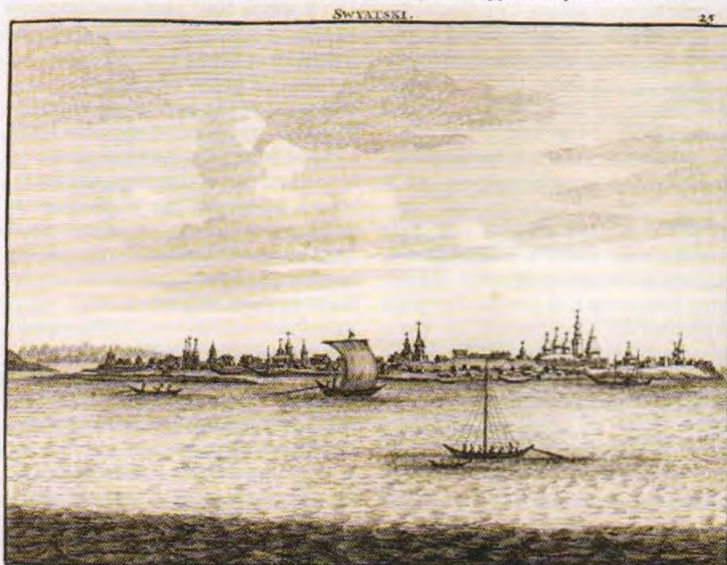
Суда на Волге. Из путешествия Корнелиуса де Бруина через Московию