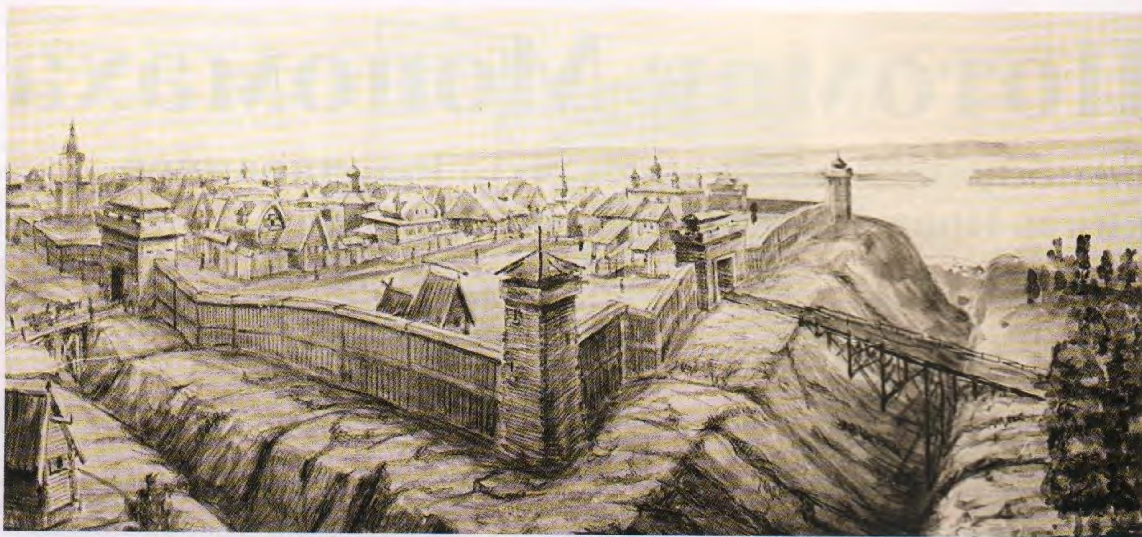
Репродукция рисунка А.Н. Грошева. Симбирск XVIII века

растет тутовое многое деревье, чем черви шолковые кормят и в том месте можно завезть шолковый промысел многой».