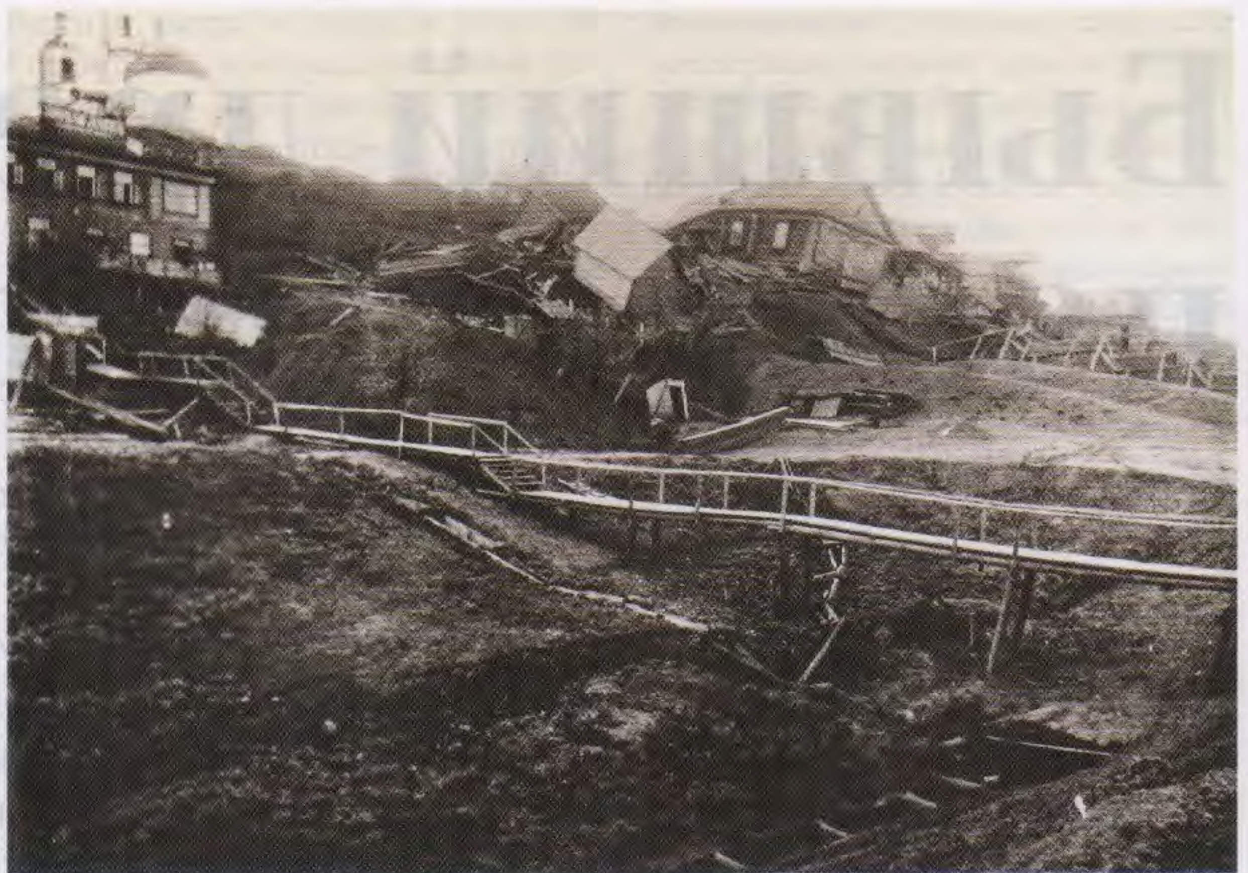
Оползень. Петропавловская церковь. 1915

Подгорьем на современной карте города можно назвать крутой волжский склон от нового Президентского моста до существующего речного вокзала и речного порта.