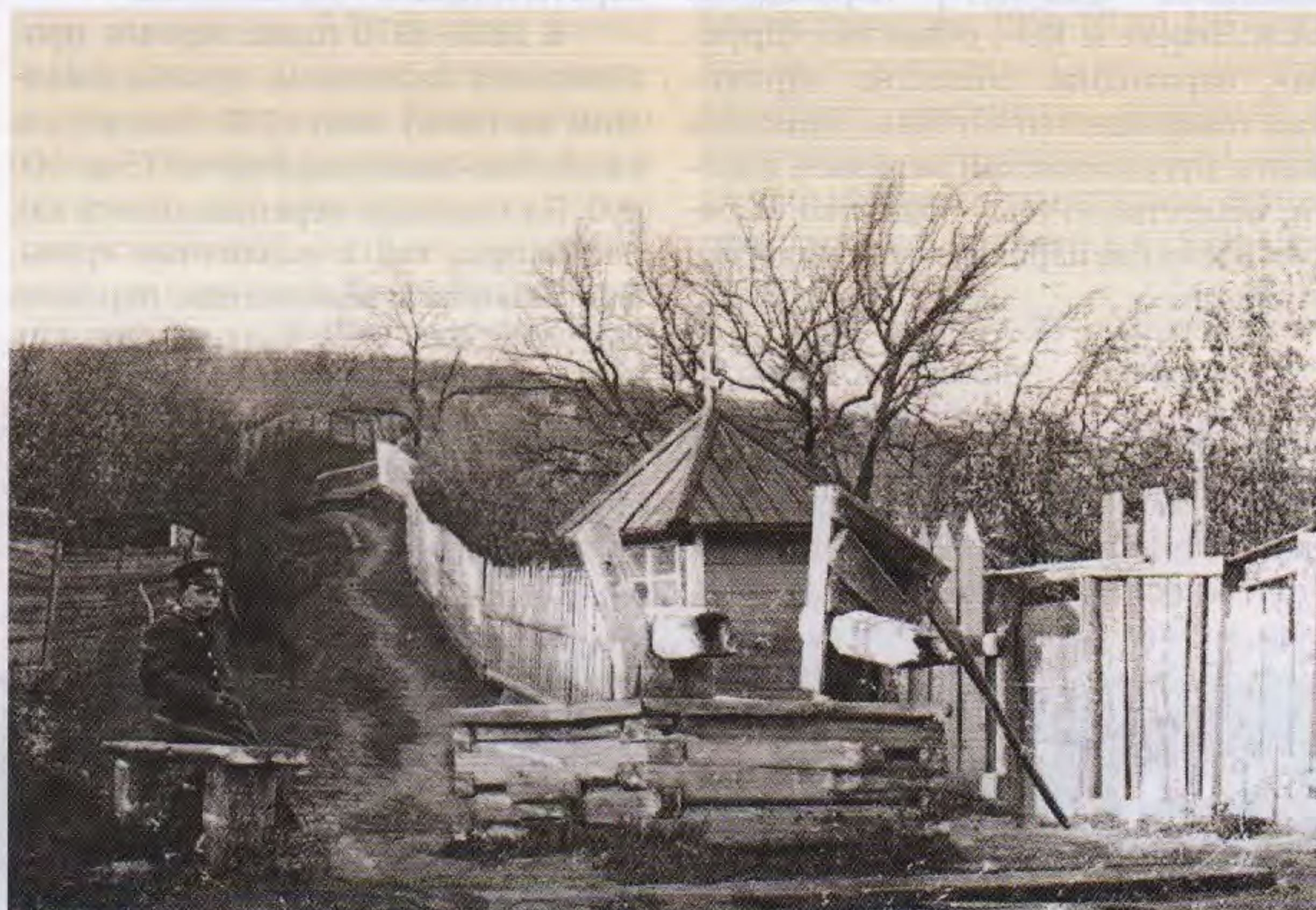
Духов спуск. Исакиевский колодец

та 1901 года о состоянии 3-го мужского приходского училища на Петропавловской улице присутствует следующая запись: «Вода для питья школьников, сама по себе хорошая, так как берется из Исаковского колодца». По рассказам старожилов Подгорья, после закрытия Спасского монастыря и выселения из него монахинь некоторые из них жили поблизости от этого колодца и поддерживали его в исправном состоянии. Бревенчатый сруб с водой существовал и был доступен еще в середине 1960-х годов. Ныне колодец затерялся в кустах и мало кого интересует.