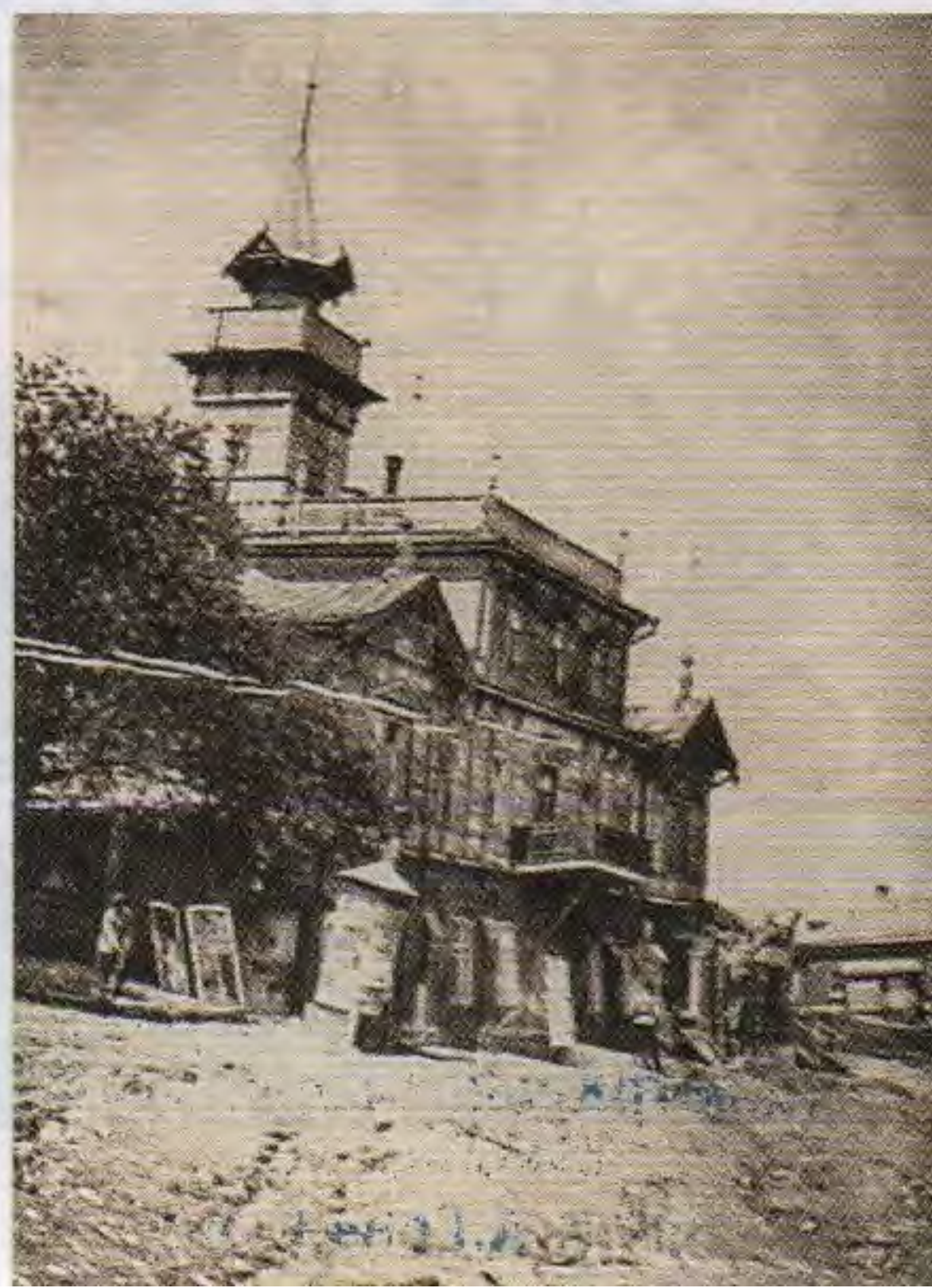
Оползень 29–31 мая 1915 года

Но оползни продолжают проявлять себя. После оползня 1979 года было прекращено движение поездов на четверо суток, встали все городские стройки; на восстановление деформированной части железной дороги потребовалось 320 вагонов щебня.