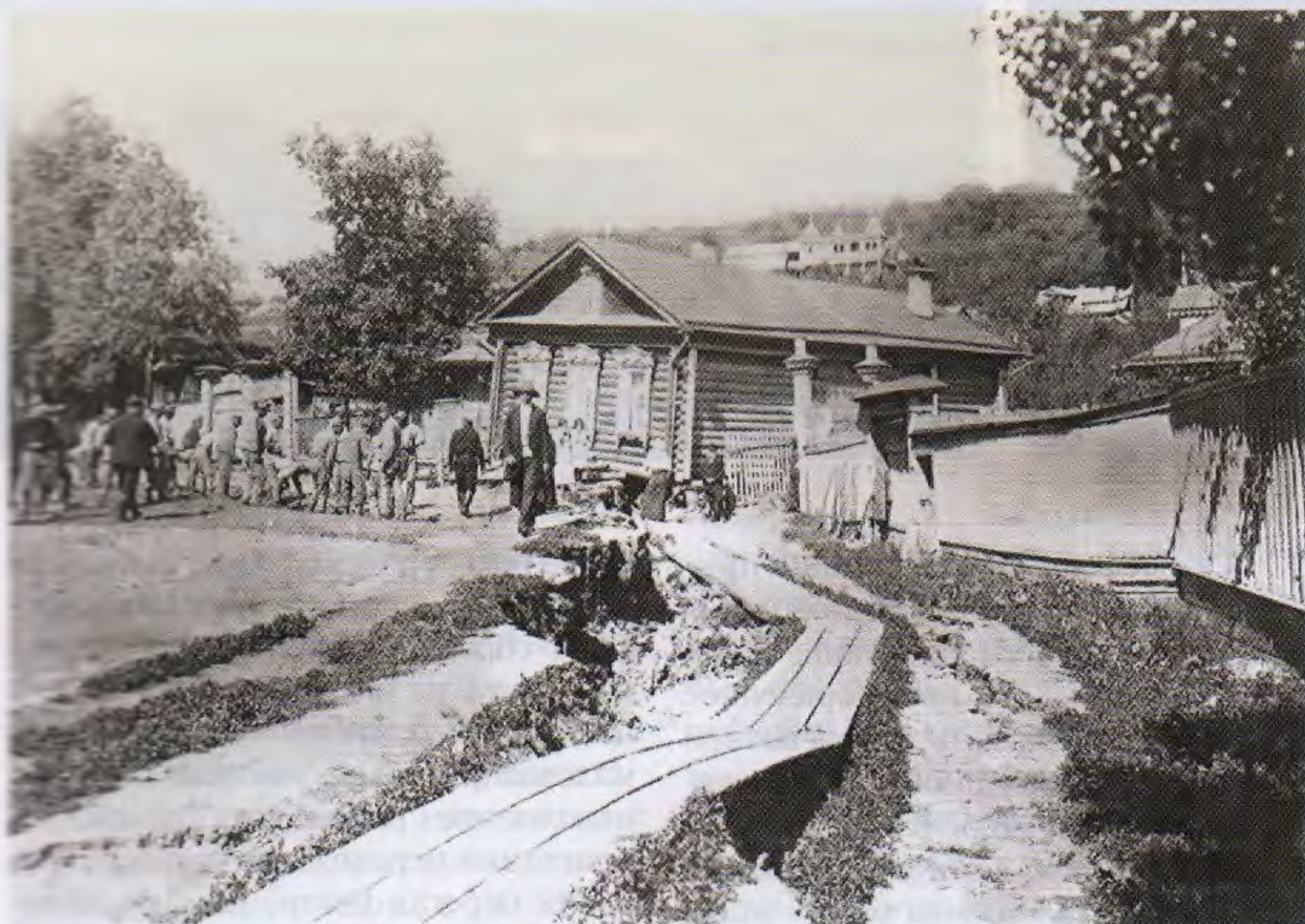
Оползень. Петропавловская дорога

В связи с созданием Куйбышевского водохранилища для защиты береговой полосы от разрушения был спланирован и покрыт железобетонными плитами береговой откос от нового речного порта до старой пристани, к северу откосная защита продолжена в виде волнобойной стенки (забережной) из железобетонных блоков и тетраподов (четырёхногих конусов массивных железобетонных фигур).