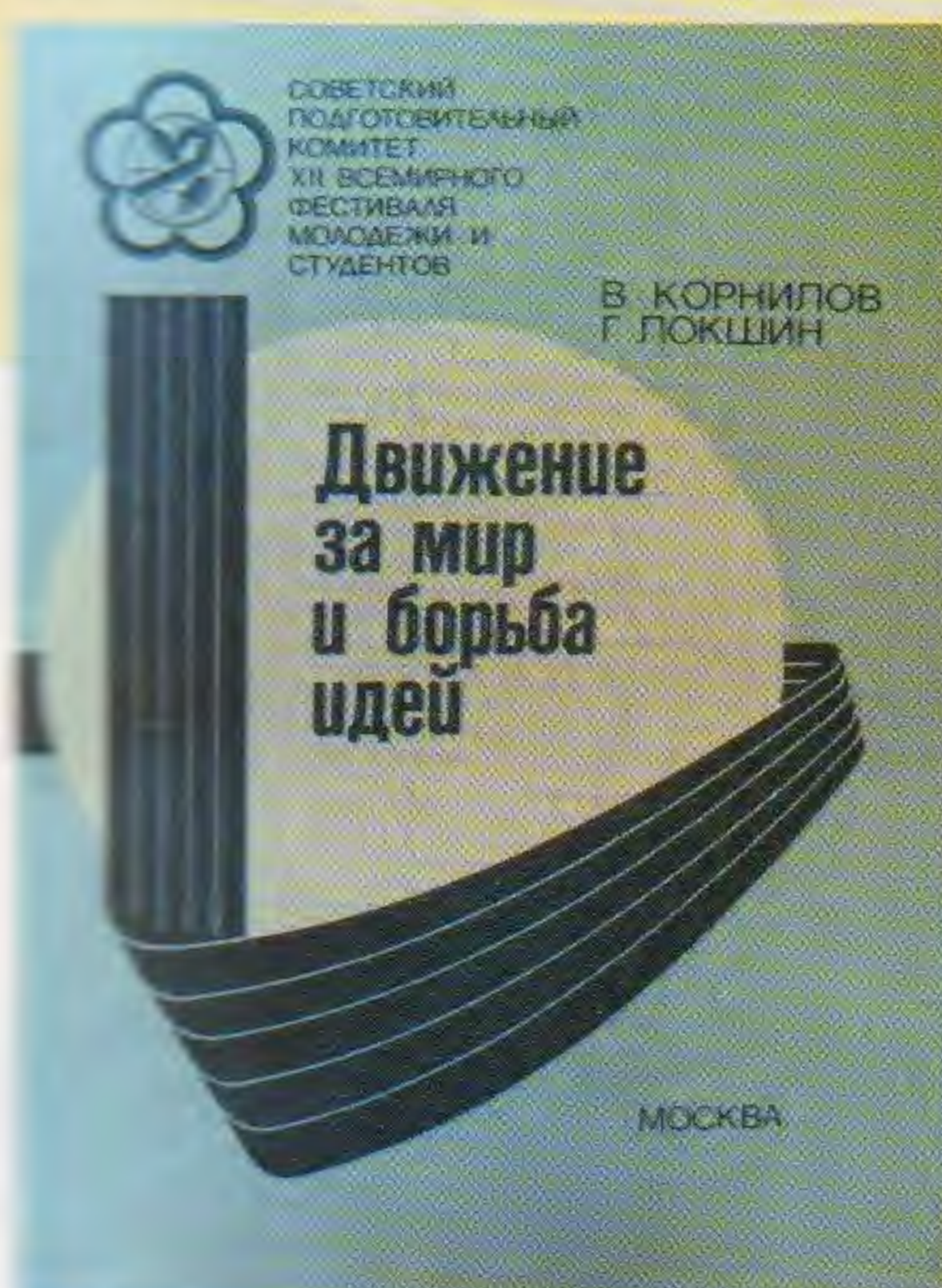
Брошюры, подготовленные и опубликованные к XII Всемирному фестивалю молодежи и студентов. 1985.