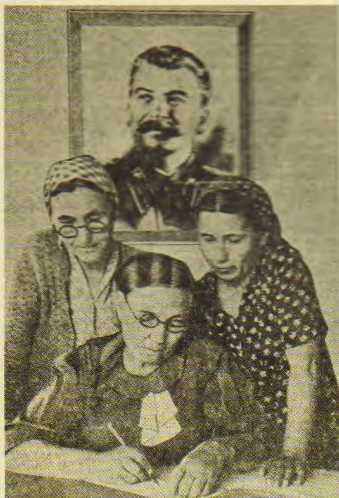
Подписание петиции в поддержку Стокгольмского воззвания о запрещении атомного оружия в Ульяновске. 1950.