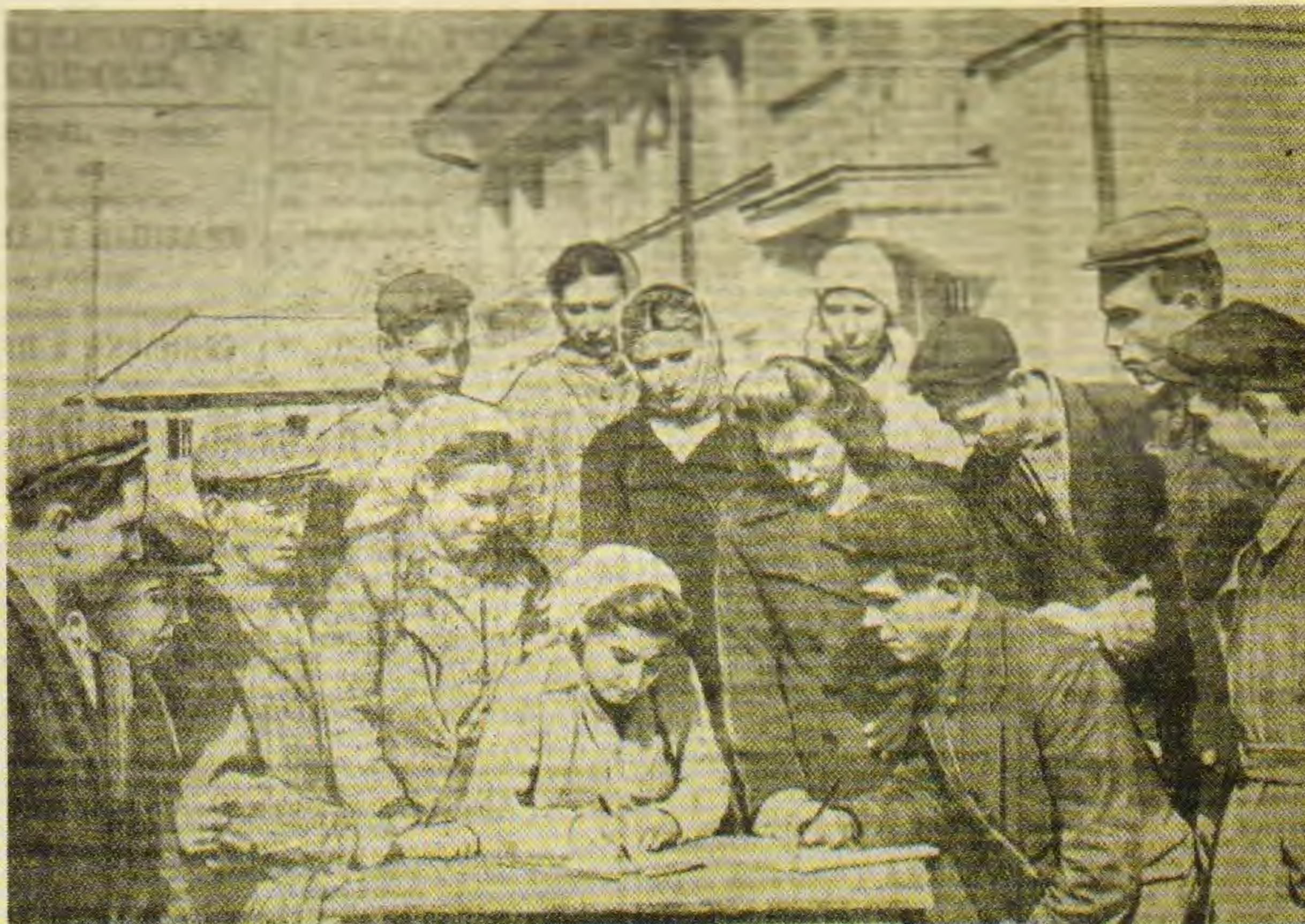
Сбор подписей в поддержку Пакта Пента. 1951. Из газеты «Ульяновская правда»

Авторы приводили примеры жестокости и кровопролития, которые по замыслу выступающих не должны были повториться. (Свыше 1500 собраний и десятки митингов прошли на территории области.)